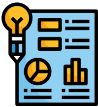
Gráfico que apoya una información.

En el huerto de la abuela Concha hay un duraznero enorme.