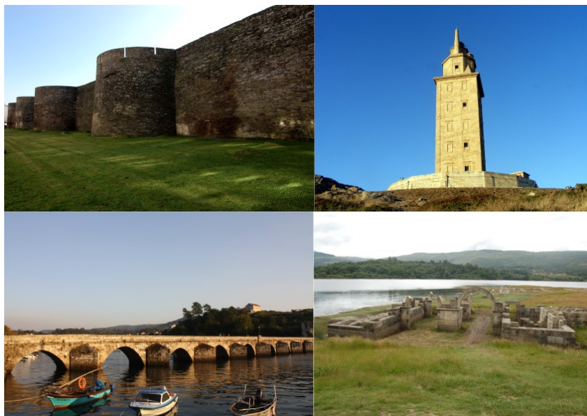
1.- Muralla de Lugo. 2.- Torre de Hércules (A Coruña). 3.- Ponte Sampaio (Pontevedra) 4.- Aquis Querquennis (Bande - Ourense)

Cando os romanos chegaron a Galicia, atraídos pola súa riqueza en ouro, estaño e ferro, atopáronse cos galaicos , un pobo celta que habitaba os máis de cinco mil castros que había entón. Os galaicos eran sedentarios e a súa sociedade estaba organizada entorno á familia, ao castro e finalmente ao populum que agrupaba a varios castros.