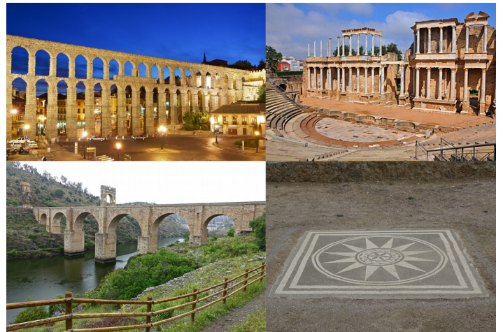
1.- Acueducto de Segovia. 2.- Teatro de Mérida. 3.- Ponte de Alcántara. 4.- Mosaico de Ampurias.

Pouco a pouco iberos e celtas foron adoptando costumes romanos, a este proceso chámase romanización , esta romanización empezou cos lexionarios romanos que se estableceron nos poboados e os converteron en cidades romanas. Estas cidades estaban organizadas arredor de dúas rúas , o cardo , que atravesaba a cidade de norte a sur e o decumanus que o facía de oeste a leste. No cruce de ambas estaba a praza, chamada foro , na que se atopaban os principais edificios. Eran excelentes construtores e fixeron templos, anfiteatros, teatros, circos, termas, acueductos e calzadas e pontes para a comunicación entre as cidades e Roma.