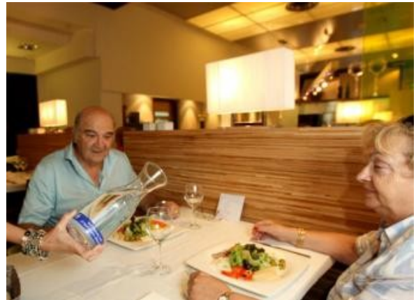
O Restaurante Avenida XXI de Donosti sumouse á campaña do Concello para servir auga da billa nos seus menús

Máis madeira verde. O Earth Policy Institute quixo facer fincapé nas distancias percorridas (e no impacto ambiental do combustible gastado) para subministrar un produto que, en condicións máis que suficientes para o seu consumo, tamén se ofrece a través das billas cun custo enerxético infinitamente menor.