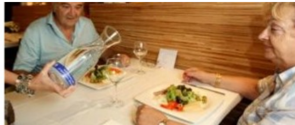
O Restaurante Avenida XXI de Donosti sumouse á campaña do Concello para servir auga da billa nos seus menús- J. IRIARTE