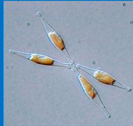
Martino and Bowler, Stazione Zoologica and Ecole Normale Supérieure, Diatomea , CC-BY