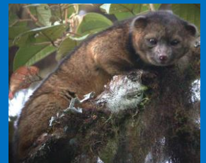
Mark Gurney, Olinguito , CC-BY

Se xa sabes clasificar e facer claves dicotómicas, es capaz entón de organizar! Pero cantas especies hai que ordenar? Só contando as especies vivas actualmente, é dicir, eliminando dinosauros e demais organismos extintos, hai máis de millón e medio de tipos de organismos para ordenar... e todos os anos descubrimos centos máis . (aínda que poda parecerche raro case todos os anos descubrimos unha nova especie de mamífero. O animalíño da dereita descubriuse no ano 2013)