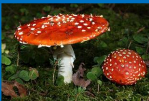
H Krisp, Amanita muscaria , CC-BY

Preparación e observación microscópica auga