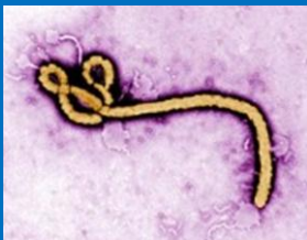
CDC global, Ebolavirus, CC-BY

Probablemente non resulta moi científico reunir nun grupo a todos os organismos demasiado pequenos para o ollo humano pero de cando en vez hai que saltar as regras. (O seguinte enlace, aquí , pode darvos unha idea do grande ou pequenos que son os organismos que estudaremos)