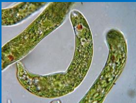
Deusterosteome, Euglena , CC-BY-SA