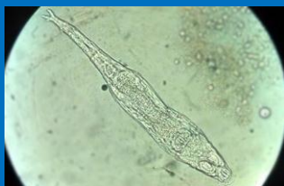
JC Fonseca , Rotífero , CC-BY-SA

Nin estas aplicacións nin ningunha son infalibles, non vos fiedes só dunha fonte.