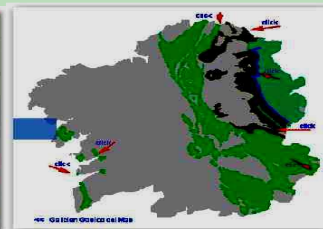
A Galiza do Primario Cambrico-Ordovícico e Silúrico