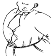
an obese person [negative, very fat]

Fat may sound impolite. Instead we often say a bit overweight . If someone is broad and solid, we can say they are stocky . A person with good muscles can be well-built or muscular . If someone is terribly thin and refuses to eat, they may be anorexic .