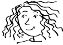
wavy hair and round-faced