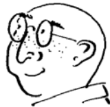
bald with freckles