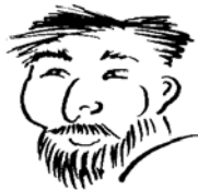
beard and moustache with a chubby face