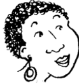
curly hair and dark-skinned