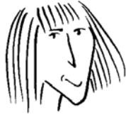
straight hair and thin-faced