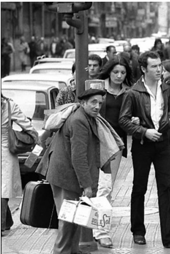
Emigrante ou inmigrante?