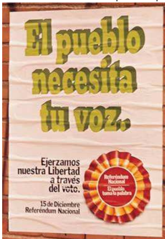
Cartel de propaganda sobre o Referendo

A Constitución ten un carácter progresista, aínda que presenta certa ambigüidade e eclecticismo, produto do consenso, que permite que o seu desenvolvemento lexislativo fora asumido tanto pola esquerda como pola dereita democrática.