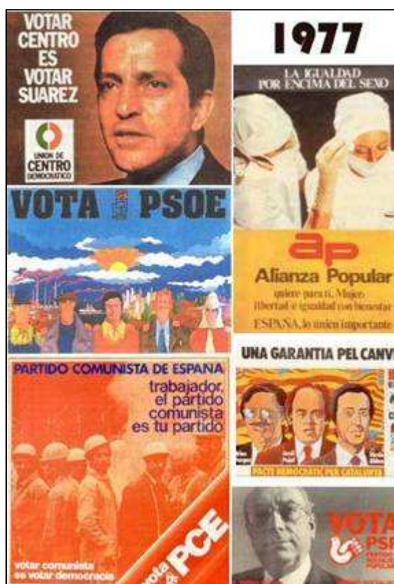
Carteis das eleccións de 1977

A UCD foi un partido creado desde o poder ao que se afiliaron a maioría dos cargos públicos franquistas (gobernadores civís, alcaldes, etc.)