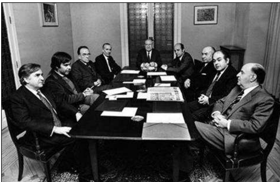
Reunión da Platajunta

As forzas antifranquistas que operaban desde o exterior agrupáronse en dous organismos: A Junta Democrática, creada en París (xullo de 1974), na que os grupos principais eran o PCE, PTE ( Partido del Trabajo de España ), PSP ( Partido Socialista Popular ) e o sindicato CC.OO ( Comisiones Obreras ) e a Plataforma de Convergencia Democrática (xuño de 1975), na que se agruparon o PSOE, varios partidos socialdemócratas e democristiáns, e algúns grupos de extrema esquerda: ORT ( Organización Revolucionaria de Trabajadores ) e MCE ( Movimiento Comunista de España ).