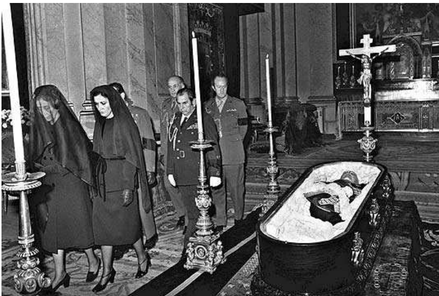
Madrid, 20 de novembro de 1975. Carmen Polo e a súa filla, a marquesa de Villaverde asisten á misa córpore insepulto por Francisco Franco.

proclamación do príncipe Juan Carlos como sucesor chegárase ao máximo de concesións. Foron chamados “o búnker” Contaban co apoio de gran parte dos altos mandos do exército. Pero nun réxime tan personalista o deterioro de Franco era motivo de crise. O bunker pretendía continuar co franquismo sen Franco. O líder deste grupo era o almirante Carrero Blanco, nomeado por Franco como xefe de goberno en xuño de 1973 e destinado a garantir a continuidade do sistema. Pero en decembro deste mesmo ano morreu vítima dun atentado de ETA. En 1974 formou goberno Arias