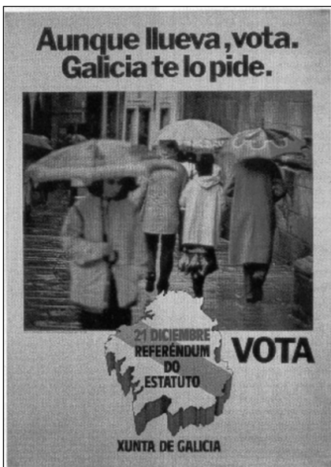
Cartel da campaña polo Estatuto Galego. 1980

As forzas nacionalistas non aceptaron o texto do Estatuto por consideralo insuficiente, promovendo o voto en contra o BN-PG e máis o PSG.