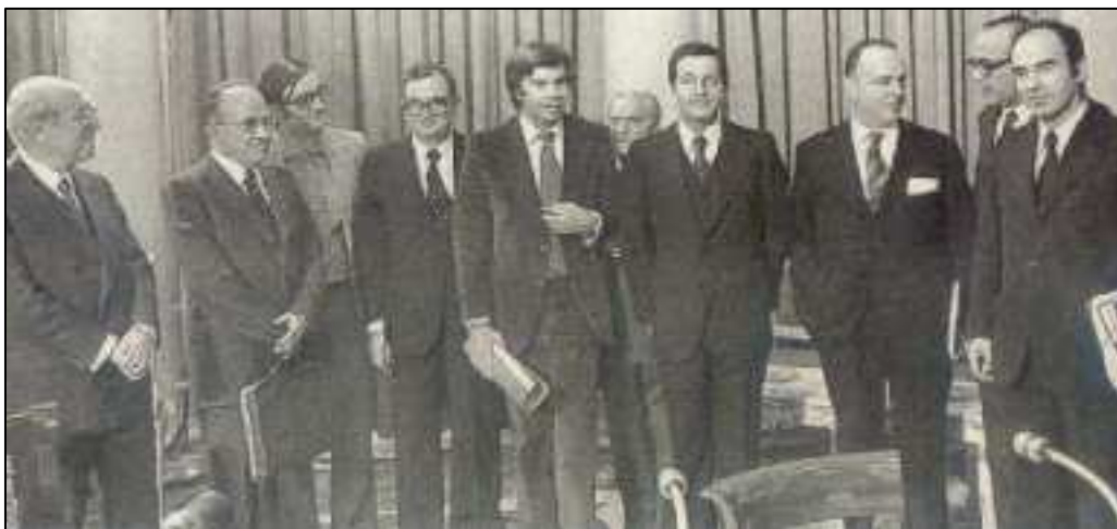
Os dez líderes políticos que asinaron os Pactos da Moncloa. 1977

Asinaron os pactos a maioría das forzas parlamentarias: AP, UCD, PSOE, PCE...e os sindicatos UXT e CC OO.