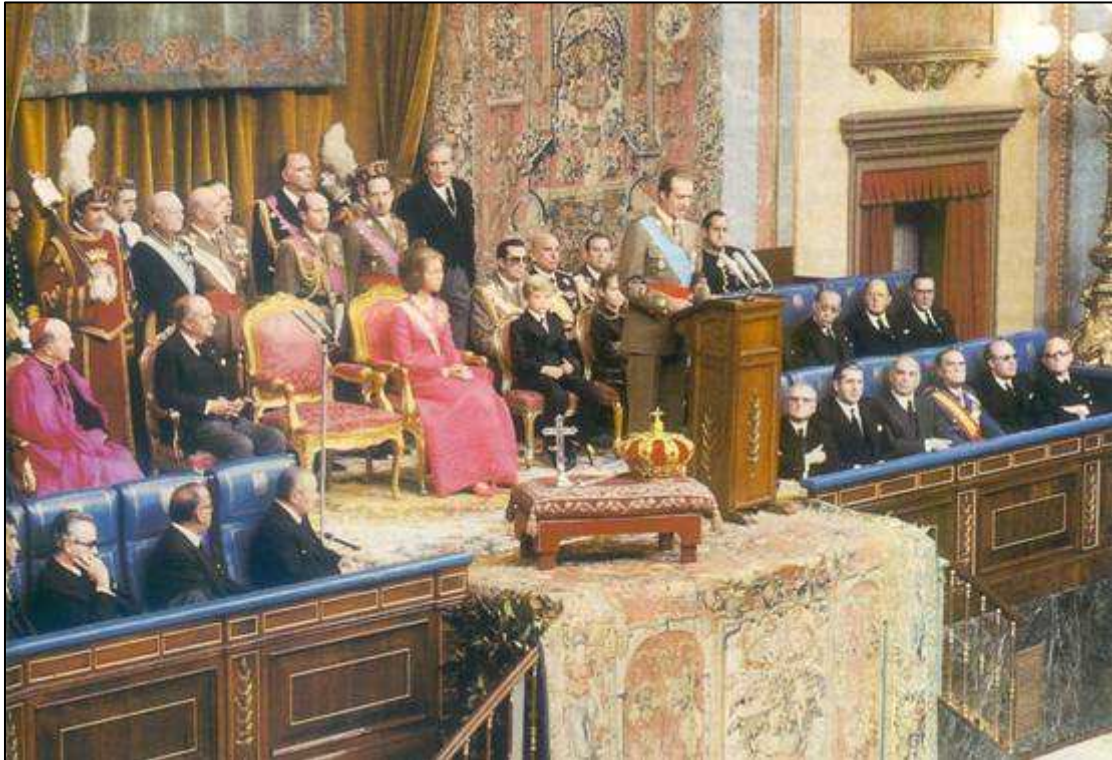
Juramento do Rei Juan Carlos ante as Cortes franquistas.1975

Formalmente, Xoán Carlos I asumía case os mesmos poderes que tivera Franco. Na primeira mensaxe da Coroa, Xoán Carlos I exalta a figura de Franco e os “principios do Movemento”, pero fixo algunha leve alusión á renovación, sen falar claramente de democracia: