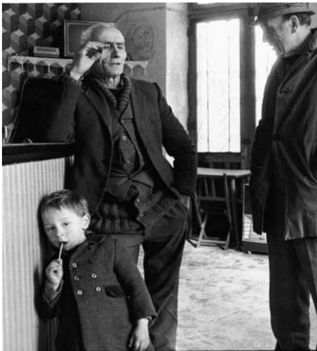
Bar en Galicia. C.Bosch

Tamén acometeuse unha reforma da Seguridade Social e un incremento do seu financiamento público, que permitiu a extensión do seguro de desemprego e un incremento das pensións de xubilación.