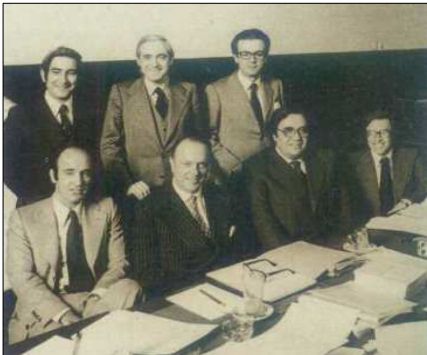
Fotografía de 1978 dos chamados pais da Constitución Española . Miquel Roca por Minoría Catalana, Fraga por Alianza Popular, Gregorio Peces-Barba polo PSOE, Jordi Solé-Tura polo PCE; Miguel Herrero de Miñón, Pedro Pérez Llorca e Gabriel Cisneros por UCD.

Os acordos foron establecidos despois de múltiples negociacións privadas entre os poñentes e os líderes dos partidos. A aceptación da Monarquía por parte dos partidos de esquerdas e do termo nacionalidades polos de dereitas foron as dúas cuestións que crearon maiores problemas entre os participantes da redacción.