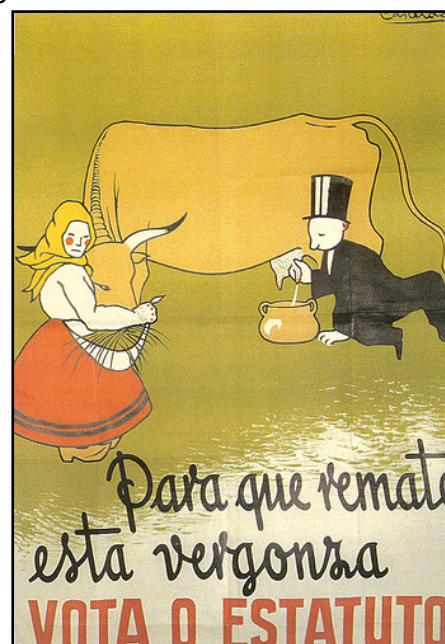
Cartel de Castelao, 1936