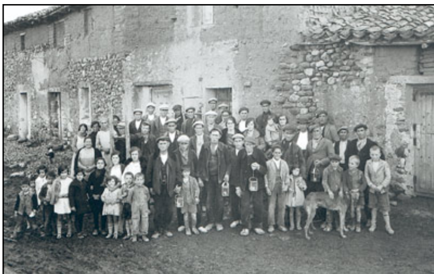
A aldea de Razbona en Guadalajara (T. Camarillo, 1930)

En resumo, a conxuntura económica europea, nun momento de auxe, favoreceu o desenvolvemento industrial do país e as exposicións internacionais celebradas en Barcelona e Sevilla en 1929 contribuíron a dar esplendor ao réxime. A industria, sobre todo