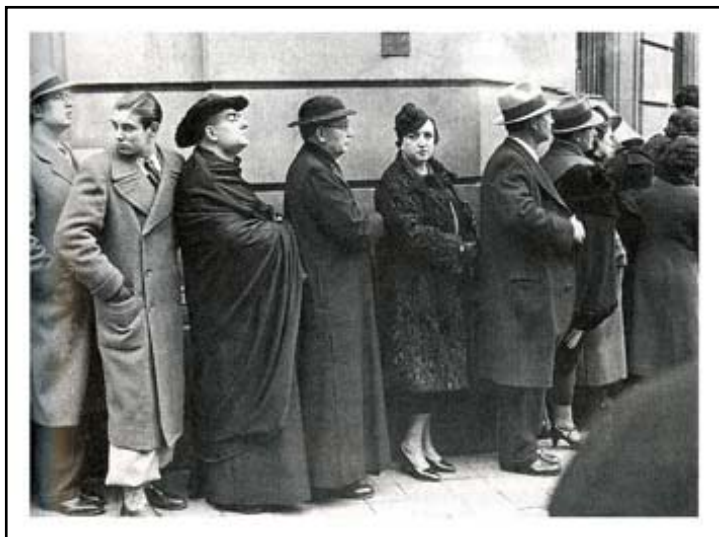
Cola para votar. novembro 1933

Na campaña electoral, as dereitas formaron unha fronte electoral única, o seu programa centrábase na revisión da lexislación laica e progresista. As esquerdas, en troques, foron divididas ás eleccións, ao fracasaren as negociacións entre os partidos. E, en canto á CNT, os anarquistas pediron a abstención electoral.