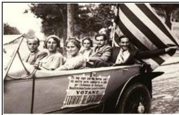
Cataláns a favor do Estatut

Aprobada a Constitución, esta mencionaba a posibilidade de conceder autonomía ás rexións que así o solicitasen. En xuño do 32, unha pequena comisión de expertos elaborou o Estatuto de Nuria, proxecto que avogaba por unha república federal, un uso exclusivo da lingua catalá e o pleno control da educación. Celebrado, a principios de agosto, un plebiscito en Cataluña sobre este proxecto de estatuto rexional, a poboación foi favorable a el nun 90% cunha participación dun 75.