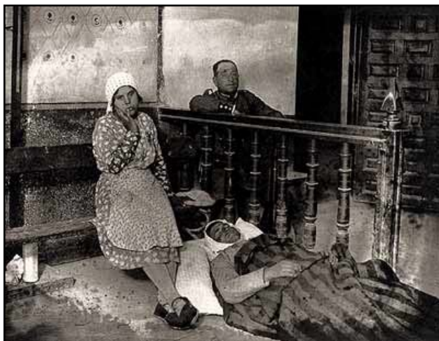
Xuízo contra os participantes nunha revolta campesiña en Vila de Don Fadrique (Alfonso, 1932)