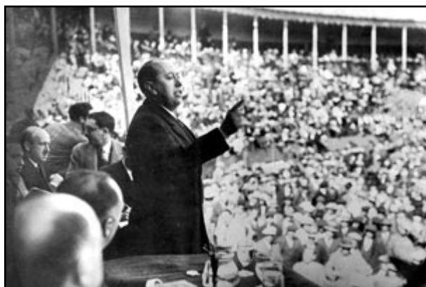
Gil Robles nun mitin, 1933

a.— Fronte de dereitas: constituída pola CEDA que se estaba a preparar para o poder que reclaman para impor a orde. Nun discurso do 7 de abril do 34, Gil Robles dicía: «Imos conquistar o Poder, ¿con este réxime?; co que sexa e como sexa», o que loxicamente provocaba a preocupación en toda a opinión republicana e de esquerdas, especialmente nos socialistas, que desconfiaban da boa fe republicana de Gil Robles, ao que consideraban disposto a establecer un réxime ditatorial similar aos