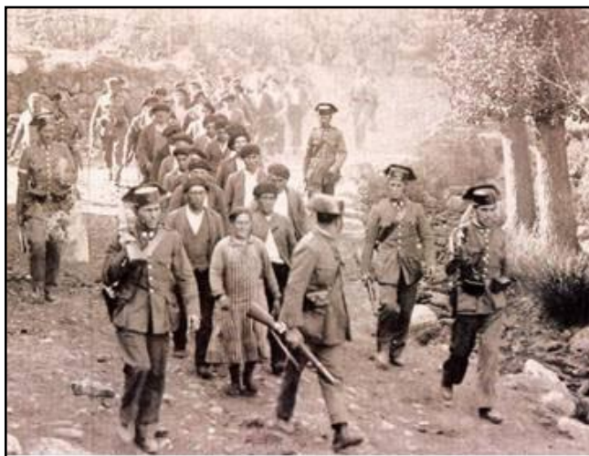
Columna de prisioneiros, Asturias 1934

Durante o ano 1935, ano no que as Cortes votaron a Lei de Contrarreforma Agraria, a conflitividade obreira e campesiña acadou as súas taxas máis baixas, o cal non se debeu a unha mellora nas súas condicións materiais de vida (os salarios seguiron baixando e o paro en novembro superaba xa as 800.000 persoas), senón á represión que seguiu a toda manifestación de protesta e ás fortes medidas de control despregadas pola Garda Civil.