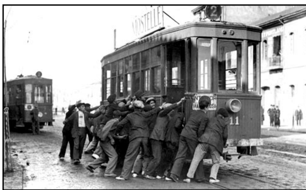
Folga en Valencia (1932)

As consecuencias políticas de Castilblanco e Arnedo foron importantes. Ante a dureza das medidas tomadas pola Garda Civil, esixiuse a destitución de Sanjurjo, e así o fixo Azaña o 5 de febreiro de 1932. A partir dese momento, Sanjurjo iniciou os preparativos do seu alzamento, xunto co xeneral monárquico Barrera. O resultado foi o golpe do 10 de agosto de 1932 (a sanjurjada ), a primeira insurrección militar contra a República. O levantamento foi desmantelado tanto en Madrid como en Sevilla: en Madrid pola Garda de Asalto e en Sevilla pola CNT