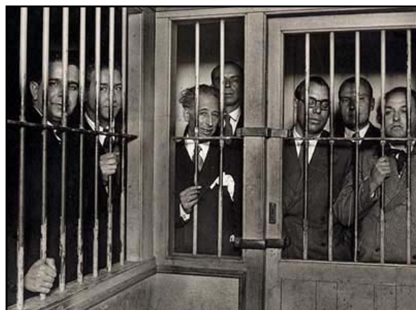
Generalitat encarcerada (Alfonso, 1934)

Cataláns: a hora é grave e gloriosa. O espírito do presidente Maciá, restaurador da Generalitat, acompañanos. Cada un no seu lugar e Cataluña e a República no corazón de todos. ¡Viva a República e Viva a Liberdade!