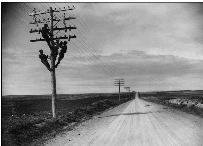
Liña de teléfonos entre Barcelona e Zaragoza (Marín, 1928)

Durante estes anos houbo un importante aumento da produción industrial cunha extraordinaria expansión do comercio exterior e un novo impulso do sistema bancario. As causas foron: a diminución da tensión social grazas á creación de moitos postos de traballo e a relativa estabilidade dos prezos, a represión exercida polas autoridades sobre a CNT e a 'colaboración' da UGT; a política arancelaria proteccionista que reservou o mercado nacional para a industria española e o