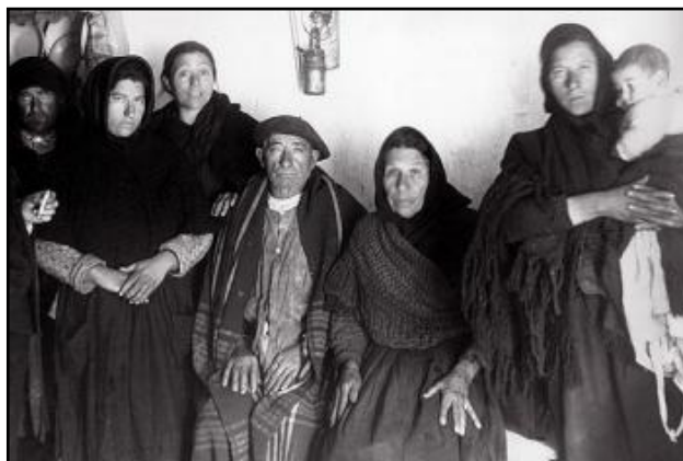
Familia campesiña (1932)

Para levar a cabo a redistribución das terras creouse o Instituto de Reforma Agraria, do que dependían as xuntas provinciais e as comunidades de campesiños. O mecanismo de actuación foi o seguinte: as terras expropiadas ou confiscadas pasaban a ser propiedade do Instituto, que as transfería ás xuntas provinciais, que á súa vez as entregaban ás comunidades de campesiños, para a súa explotación colectiva ou individual, segundo tivesen decidido previamente os campesiños.