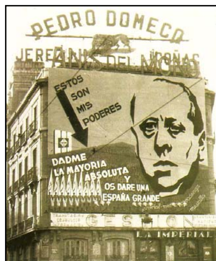
Propaganda da CEDA

A dereita reaccionou chamando á intervención do Exército: Gil Robles tentou convencer a Portela Valladares da necesidade de declarar o estado de guerra, José Antonio Primo de Rivera chegou para pedir armas para que a Falange se defendera e o xefe do Estado Maior, xeneral