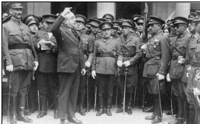
Discurso de Azaña, Ministro de la Guerra

Case a metade dos posibles beneficiarios acolléronse á lei antes de acabar o ano. A nova Lei admitindo o retiro, co soldo íntegro, de todos os xenerais e oficiais que non quixeran prestar xuramento de fidelidade á República, foi o procedemento escollido para acabar cos excedentes e asegurarse, polo menos teoricamente, a lealdade do Exército. Ademais destas medidas, Azaña tomou tamén outras: Os organismos xudiciais especiais do Exército foron progresivamente disoltos ata a eliminación do fuero militar; a