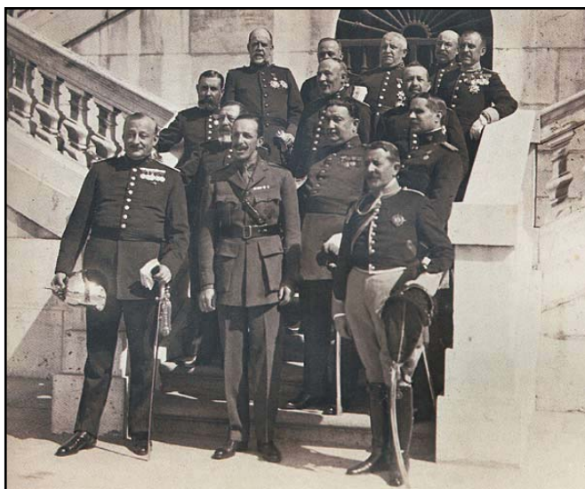
O Directorio Militar con Alfonso XIII

«xunta militar» e foron desmanteladas as institucións constitucionais (salvo o Rei) e mesmo aos tribunais se lles quitan importantes funcións en beneficio da xurisdición militar. Este Directorio