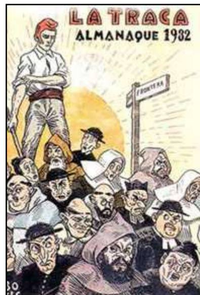
Ilustración anticlerical do diario satírico La Traca

Foi tamén a redacción definitiva do anticlerical artigo 26 a que levou a Alcalá Zamora e Miguel Maura a retirarse do goberno. Deste xeito, por contraditorio que pareza, terminaron colocándose, como dicía Alcalá-Zamora sendo aínda xefe do goberno, «dentro da República e fóra da Constitución». Tendo como base a separación da Igrexa e o Estado marcada polo devandito artigo 26, ao longo de 1932 e 1933 fóronse promulgando leis e decretos complementarios e que desenvolvían o artigo constitucional: promulgouse a extinción en dous anos do presuposto do clero e culto e o sometemento das ordes relixiosas a unha lei especial; disolución da Compañía de Xesús e confiscacións dos seus bens; matrimonio civil, divorcio e secularización dos cemiterios; prohibición do ensino ás ordes relixiosas. A República non prohibiu o ensino ós relixiosos individualmente, nin sequera a dirección de colexios. De feito e de dereito, os relixiosos, tanto seculares como regulares, podían exercer e exerceron, como profesores en colexios particulares e en institucións do Estado. O que se prohibiu ás ordes relixiosas foi recibir e educar alumnos nos seus colexios; é dicir, exercer o ensino corporativamente, como tales ordes relixiosas, pero sen impedir ós seus compoñentes aquel exercicio a título individual.