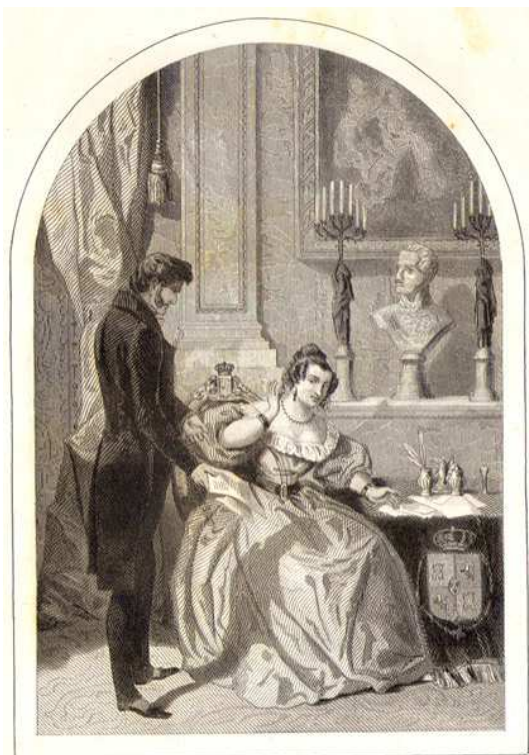
M a Cristina e Mendizábal. 1860

Juan Álvarez de Mendizábal, ben desde o cargo de ministro de Facenda ou presidindo o Consello de Ministros, iniciou a desamortización dos bens e terras eclesiásticas