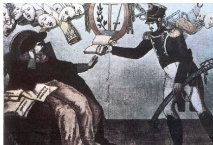
A Inquisición enferma ante a Constitución de 1812

Os liberais no poder durante o Trienio van aplicar unha política claramente anticlerical : expulsión dos jesuítas, abolición do diezmo, supresión da Inquisición, desamortización dos bens das ordes relixiosas... Todas estas medidas trataban de debilitar a unha poderosísima institución oposta ao desmantelamento do Antigo Réxime. O enfrontamento coa Igrexa será un elemento crave da revolución liberal española.