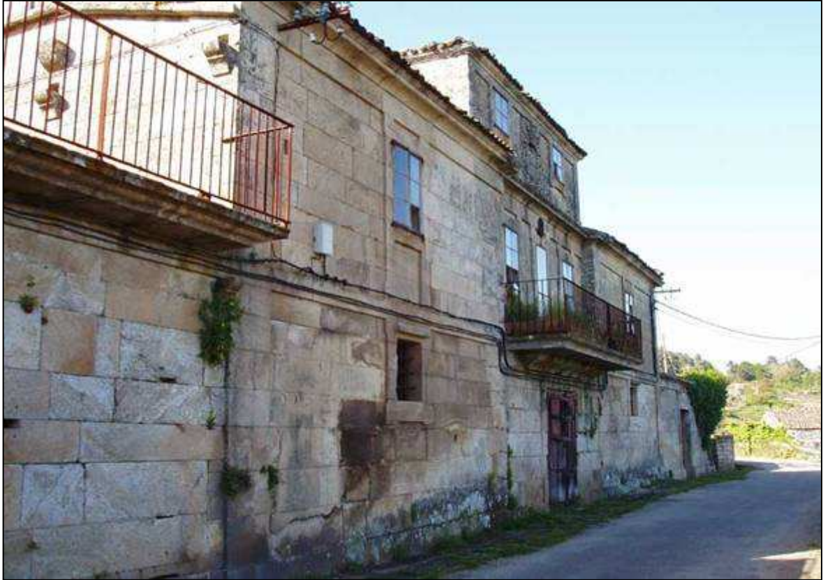
Pazo Banga. Carballiño

Estas medidas liberalizadoras contribuíron á prosperidade de zonas como Cataluña, que puideron abrirse á exportación. Cádiz seguiu sendo o gran porto no século XVIII pero o seus negocios eran de reexportación: as mercadorías que chegaban de toda Europa eran embarcadas cara á América. Esta actividade non repercutía na prosperidade do resto de Andalucía. Outros portos como o de Barcelona especializáronse na exportación de produtos locais (augardente, tecidos, etc..) contribuíndo ao crecemento económico de Cataluña.