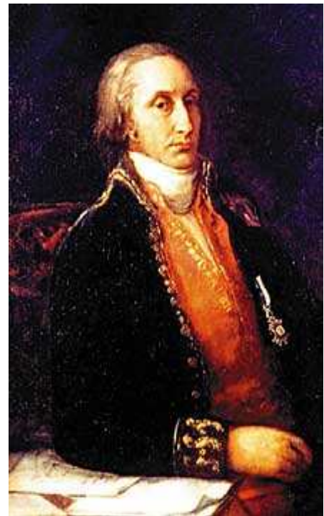
Marqués de Sargadelos. Goya