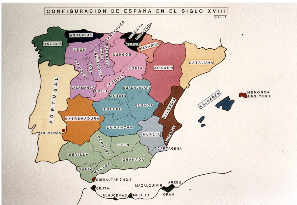
División administrativa da España do século XVIII

No terreo da política territorial, a Guerra de Sucesión (na que os reinos da Coroa de Aragón apoiaran a Carlos) foi aproveitada por Filipe V para suprimir os fueros (leis particulares) destes reinos mediante os chamados Decretos de Nueva Planta (Valencia e Aragón 1707; Mallorca 1715, e Cataluña 1716) que trasladaban a Aragón a lexislación castelá. Unicamente Navarra e as provincias vascas, que apoiaran a Filipe na Guerra, mantiveron os seus fueros . Así todo o territorio constituíu unha única estrutura de carácter uniforme.