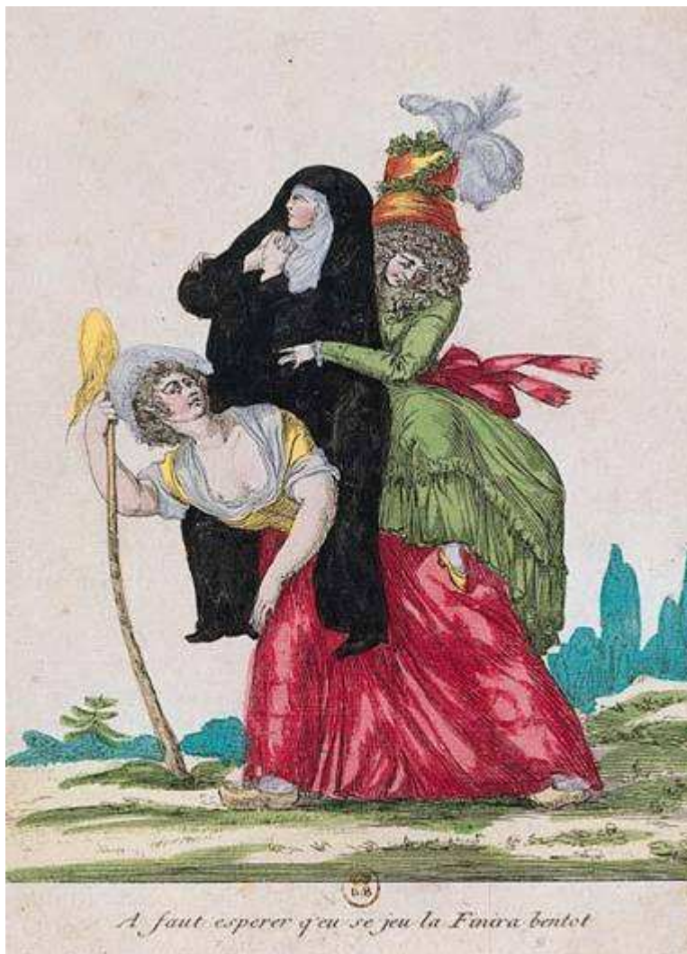
Representación estamental do Antigo Réxime

Segundo o tipo de autoridade, o señorío podía ser de reguengo ou realengo (rei), secular (nobres) ou eclesiástico (bispos, mosteiros, abades...).