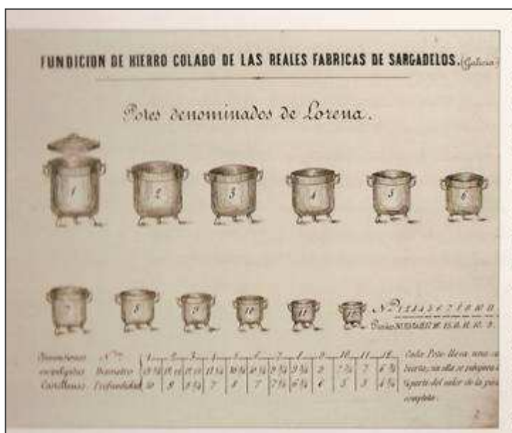
Catálogo de produtos das Reais Fábricas de Sargadelos

As fraguas eran pequenos talleres artesanais onde ata tres ferreiros requentaban o lingote procedente