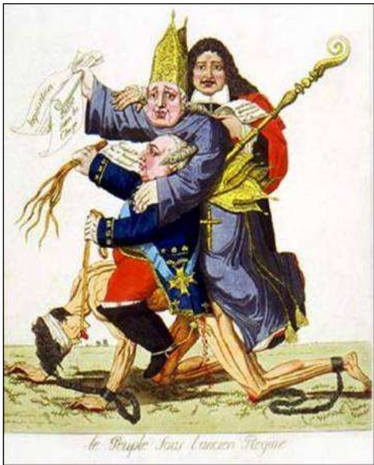
Caricatura da sociedade estamental

Na España do XVIII mantense a sociedade estamental , que ten como características esenciais a desigualdade xurídica e o inmovilismo social. Os grupos privilexiados (nobreza e clero) posuían a maior parte das propiedades, non pagaba impostos e ocupaban case todos os cargos públicos.