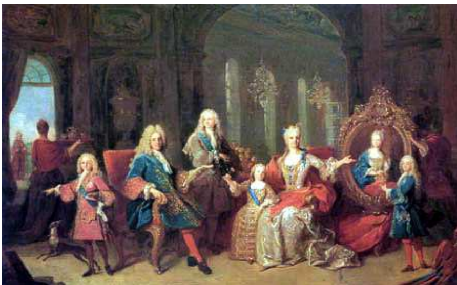
A familia de Filipe V. Jean Ranc. 1722

Dentro do espírito ilustrado dominante no século en Europa, os Borbóns pretenderon aplicar un programa reformista que modificase o sistema, facéndoo máis eficaz desde o punto de vista económico, pero que non o cuestionase. Impuxeron unha