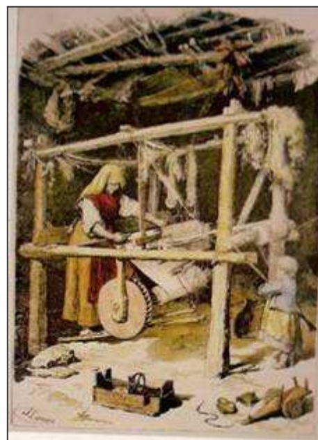
Tear 1879. Ilustración Gallega y Asturiana

Durante os séculos XVIII e XIX non se introduciron melloras técnicas nas formas de organización da produción, nun momento no que as actividades como o traballo de algodón experimentaron unha importante transformación e baixa nos custos. Os lenzos galegos foron desprazados dos mercados casteláns e andaluces polas novas producións de algodón inglés ou catalán, o que supuxo a liquidación das actividades das persoas que estacionalmente se ocupaban da produción e distribución, co conseguinte empobrecemento dunha fracción importante das explotacións familiares de Galicia. Isto provocou tamén unha redución da