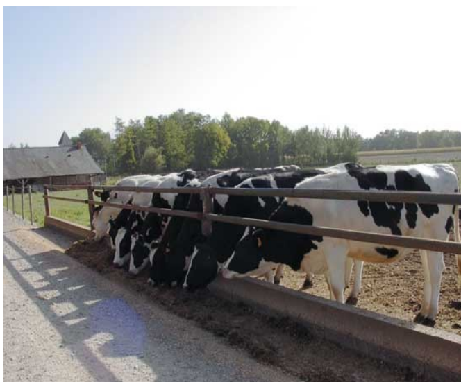
Os exemplares de frisona holandesa supoñen máis do 80% do gando vacún existente nas explotacións galegas.

comercialización da produción de carne ou de leite. Na produción leiteira, coa intención de acadar maiores rendementos, produciuse a incorporación de razas alóctonas como a frisona holandesa. Hoxe esta especie representa entre o 80/90% do gando vacún. As aptitudes naturais de Galicia para a produción de leite, así como o aumento da demanda debido ao aumento da poboación urbana contribuíron ao progresivo aumento da produción desde 1960. Galicia é a primeira rexión produtora de leite do Estado. As principais zonas leiteiras son as provincias de Lugo, A Coruña e parte de Pontevedra,