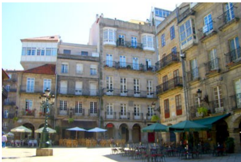
A fachada atlántica concentra as actividades económicas máis dinámicas . Na foto a cidade de Vigo.

Por último, existe unha comisión específica, constituída polo Eixo Atlántico do Noroeste Peninsular, que se ocupa da política urbana das cidades que forman parte do mesmo.