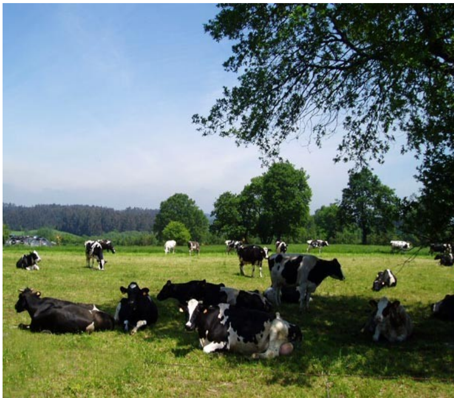
A necesidade de pastos para o gando transformou a paisaxe agraria de numerosas comarcas do país.

Cada vez é máis habitual en moitas zonas de Galicia que a proporción de empresarios agrarios maiores de 55 anos supere o 60%. Esta situación mitígase un pouco nas Rías Baixas e Baixo Miño, no occidente coruñés, no centro da meseta lucense e nalgúns vales ourensáns onde se localizan explotacións medianas modernizadas e explotacións pequenas especializadas, viñedos e produción hortícola.