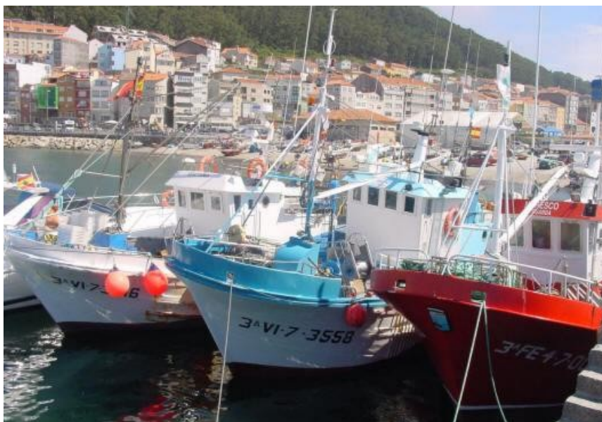
A frota de baixura caracteriza a realidade pesqueira da maior parte dos portos do país.

A pesca marítima é unha actividade de grande tradición histórica en Galicia. A costa galega é moi extensa, pois conta con mais de 1000 km, artellada en sucesivas rías e a cuxo abrigo se instalaram numerosos portos. No ámbito pesqueiro estatal, o protagonismo da frota galega consolidouse, representando o 40 % do total da pesca desembarcada. As capturas iniciaron unha tendencia à