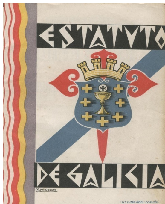
Durante a II República fora aprobado o primeiro estatuto de Autonomía para Galicia. A Guerra Civil imposibilitou que se puidera materializar.

A nova figura administrativa foi paulatinamente asumindo a xestión de maiores áreas, ficando