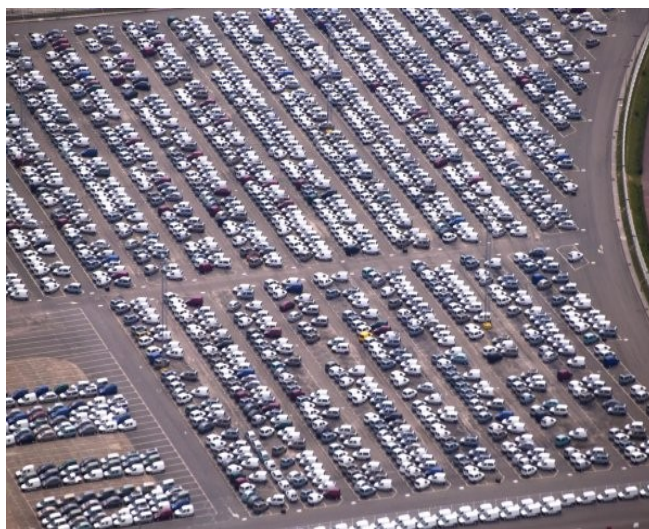
Gran parte da produción automobilística que se produce en Vigo sae para o seu destino a través do porto da cidade.

Entre os portos existentes destacan tamén no plano comercial o da Coruña, Ferrol e San Cibrao. As ampliacións realizadas no porto da Coruña colocárono entre os mellores equipados da fachada atlántica para recibir grandes buques mercantes. Está especializado como porto industrial petroleiro e graneis sólidos xunto coa pesca. Nestes momentos, estase construíndo un porto exterior, onde se pretenden trasladar as instalacións portuarias localizadas na fronte marítima da cidade. Ferrol ven de inaugurar o seu porto exterior que destaca polo tráfico de minerais para a central térmica das Pontes. Vilagarcía e Marín completan a rede