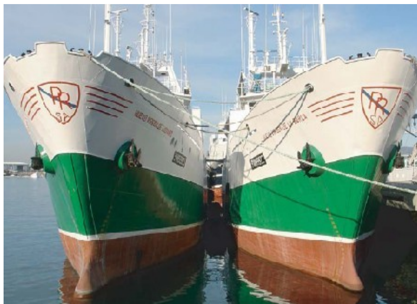
A crise vivida pola pesca de altura levou ao amarre a boa parte da frota galega que pescaba en diferentes mares do planeta.

Na estrutura da poboación activa no sector destaca a porcentaxe alta de mariñeiros que, nas frotas de baixura, sobre todo nas Rías Baixas, comparten a pesca con outras actividades. No ámbito da pesca de altura os mariñeiros teñen a pesca como única dedicación. Tamén na idade dos traballadores do mar existen diferencias entre as dúas frotas, así a maior proporción de mozos na frota industrial contraponse ao maior media