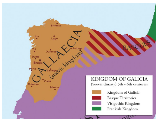
Os límites da Galicia sueva espallábanse mais alá do territorio que hoxe chamamos Galicia.

A entrada dos musulmáns na Península provoca a liquidación do Reino Visigodo no século VIII. Confórmanse dúas realidades políticas, a parte musulmán, que as crónicas denominan España, e Galicia. Durante os séculos posteriores, malia os intentos de consolidación, a realidade territorial que se deu en chamar Reino de Galicia revélase inmersa nunha inestabilidade continua ate o século