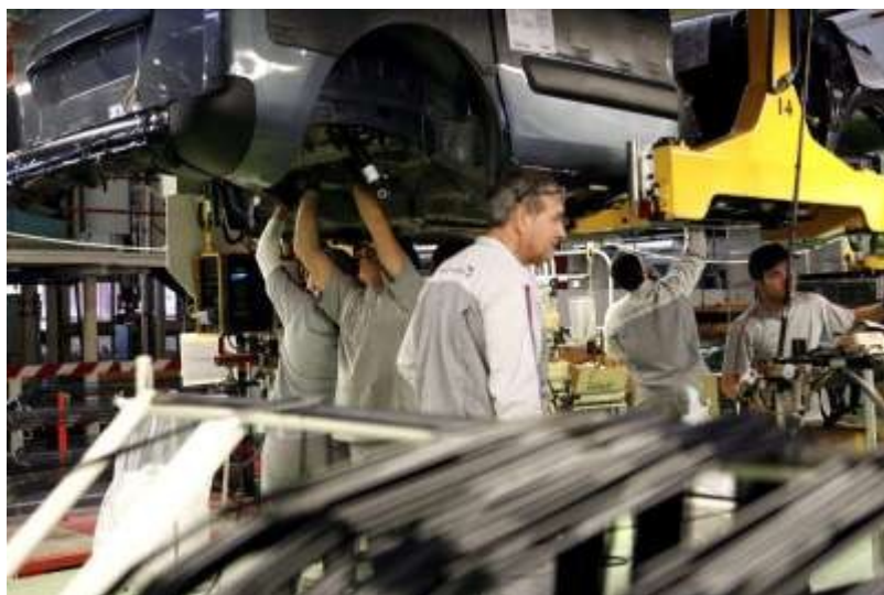
O sector da automoción aparece localizado en Vigo e na súa área. Agrupa numerosas empresas, entre as que destaca a factoría da multinacional Citroën.

Pola contra, na zona oriental as actividades industriais aparecen localizadas en pequenos focos, vinculados ás cidade capitais. Así, en Ourense e o seu entorno existe unha concentración industrial de certo entidade, que conforma o sector industrial provincial xunto coa comarca de Valdeorras, onde destaca o sector extractivo da lousa. Dous focos industriais destacan en