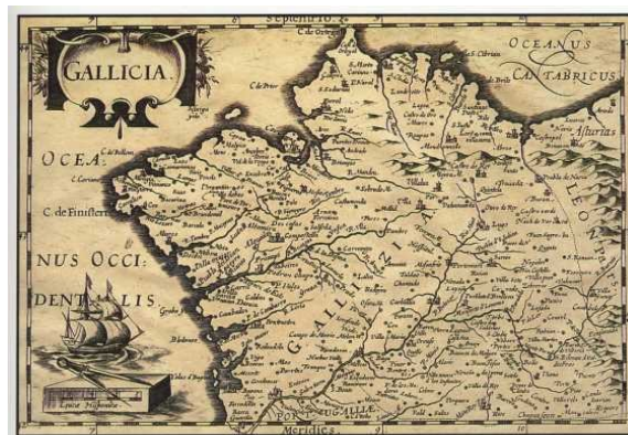
Mapa do reino de Galicia no século XVII.