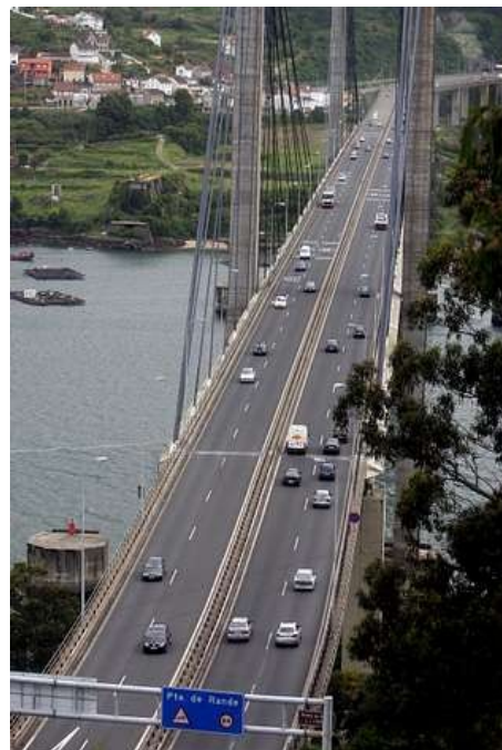
Coa apertura da AP-9 conseguiuase o artellamento da fachada atlántica do país.

Nas economías desenvolvidas, os medios de transporte facilitan a comunicación entre os ámbitos de extracción ou elaboración e os mercados. Así un dos problemas mais graves que tivo Galicia en relación ás súas posibilidades de desenvolvemento foi a deficiente rede de transportes con que contaba o país. Por causa da localización e da configuración do seu relevo, Galicia mantívose secularmente illada do resto da Península. Só os portos marítimos foron quen de romper as