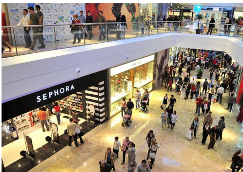
Nas áreas urbanas do país concéntranse a maior parte dos centros comerciais que abriron as súas portas nos últimos anos.

A partir dos anos sesenta foise configurando en Galicia un importante sector dos servizos, converténdose na actualidade no sector que maior aportación, 58%, realiza ao PIB (Produto Interior Bruto) do país. Baixo a denominación de actividades terciarias podemos incluír un amplo grupo de actividades. De todas as ramas que compoñen este heteroxéneo sector, na