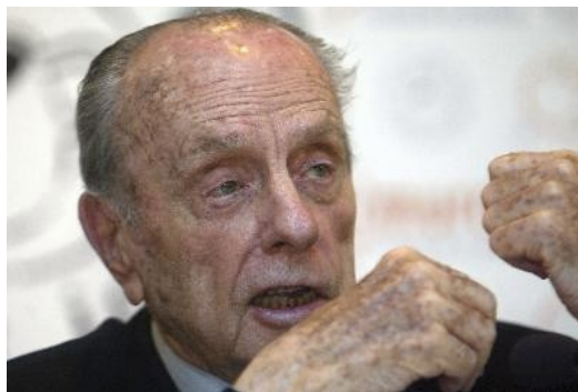
Manuel Fraga, Presidente da Xunta durante 4 lexislaturas consecutivas

As sucesivas maiorías absolutas permitiu a elaboración de importantes proxectos para o futuro de Galicia, que tiveron resultados moi dispares. O plan de organización comarcal, un ambicioso plan de reforma administrativa, atopou moitas resistencias e non se puido coordinar co papel das Deputacións, tamén gobernadas polo propio PP. A xestión da sanidade ou da educación tivo moitas eivas: a carencia de fondos, os modelos de xestión e mesmo resolucións que primaban os localismos impediron uns maiores realizacións. A política cultural orientouse cara á realización de grandes eventos, onde os sucesivos Xacobeos son unha boa proba. Mais durante os seus mandatos produciuse un gran avance nas infraestruturas, sobre todo no relativo á unión coa Meseta a través das autovías.