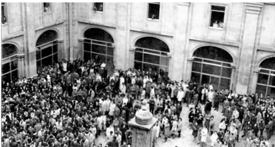
Mobilizacións estudantís na Universidade de Santiago en 1968