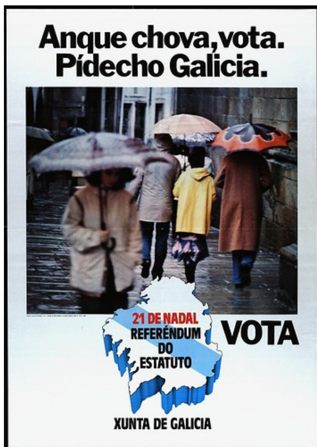
Publicidade institucional do Referendo do Estatuto de Galicia

O lema “ Anque chova, vota. Pídecho Galicia ” presidiu a campaña electoral do referendo que foi convocado para o 21 de decembro de 1980. Entre os partidarios do si dirimiuse unha loita por quen apoiara máis a consecución da autonomía, mentres que as forzas nacionalistas, moi divididas, optaron entre pedir o non ou votar en branco. O referendo contou cunha participación ínfima, do 28,3%, dos cales un 72,6% votaron a favor do novo Estatuto. Este grande abstención pode ser explicada porque a dereita e grande parte da UCD non se esforzaron en animar a participación, mentres que o groso das forzas nacionalistas se opuxeron.