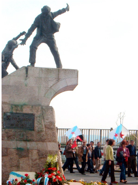
Monumento conmemorativo dos sucesos do 10 de marzo de 1972. O Ferrol