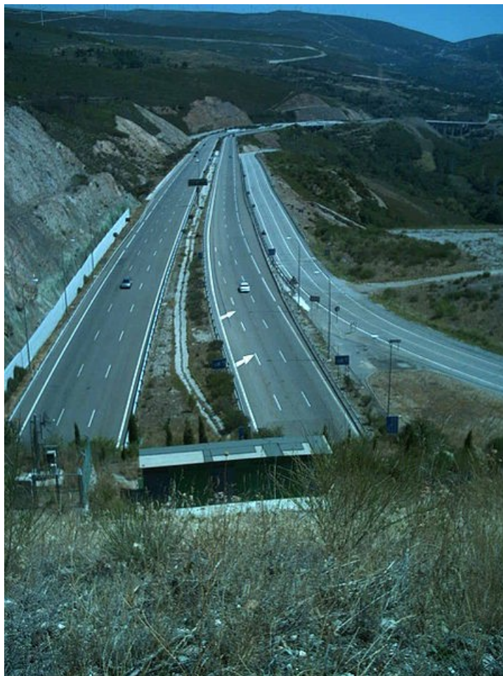
A autovía A-52 á altura do túnel da Canda

O balance macroeconómico de Galicia na Unión Europea contén aspectos positivos e negativos. O PIB galego creceu de modo destacable en termos absolutos e produciuse unha