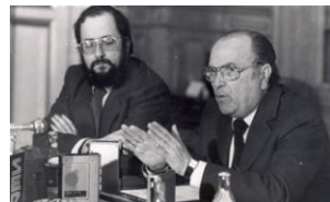
Albor e Barreiro na noite electoral

O primeiro grande problema ao que tivo que facer fronte foi á cuestión da capitalidade. Ante as declaracións do Presidente, que promoveu a Santiago coma capital, cuestión na que estaban de acordo as forzas nacionalistas, a UCD permaneceu dividida e dende A Coruña se iniciou unha forte campaña para conseguir a capitalidade, incluída unha multitudinaria manifestación. Finalmente o pleno do Parlamento aprobou unha resolución que sen declarar a capitalidade de Santiago (só se fará oficial no 2002), outorgaba a Santiago a sede da Xunta, mentres que A Coruña ficaría co Tribunal Superior de Galicia e a Delegación do Goberno en Galicia. Boa proba da forza do localismo, a aprobación contou con 7 votos en contra, todos de deputados residentes na Coruña, aínda que de diferentes forzas políticas.