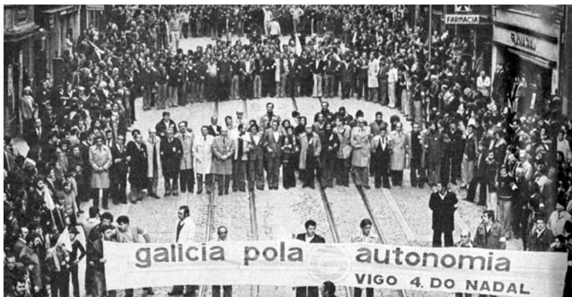
Manifestación a prol do Estatuto, en Vigo

Finalmente a Galicia foille concedida a preautonomía polo Real Decreto-lei 7/1978 de 16 de marzo, un día antes de que establecesen as de Aragón, Canarias e Valencia, co que se respectaba a cronoloxía da II República, ficando Galicia dentro das “tres nacionalidades históricas” fronte á masa das demais “rexións”.