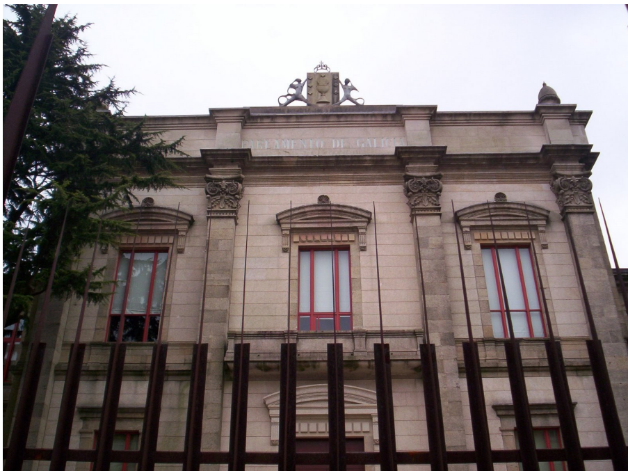
Sede do Parlamento de Galicia. Santiago de Compostela

Camiño das primeiras eleccións autonómicas, o mapa político galego seguía moi convulso. A UCD vivía unha descomposición no conxunto do Estado, división interna que tamén era palpable en Galicia, con enfrontamentos públicos entre os seus principais líderes. O nacionalismo presentábase dividido e con continuas mutacións nas forzas políticas: nacía EG, que abandonaba os posicionamentos frontistas, mentres que se reforzaba a alianza entre o PSG e o BNPG e o PG camiñaba só.