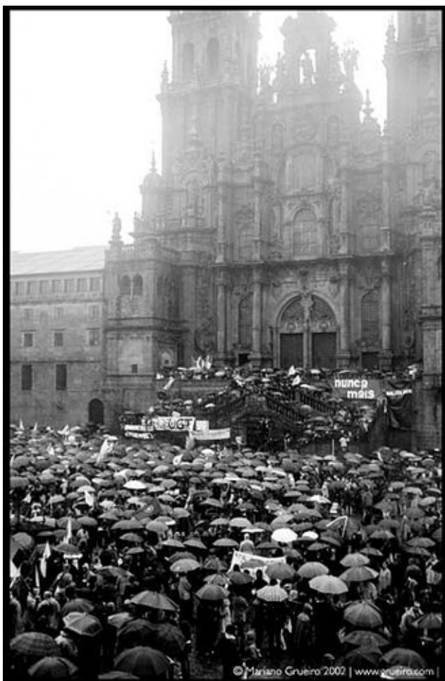
Nunca Máis mobilizou á sociedade galega