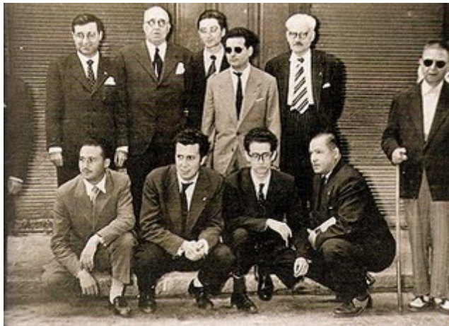
Grupo Brais Pinto

O Partido Comunista (PCE) era a organización que mantivo unha mellor organización na época da clandestinidade. Coa creación