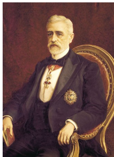
E. Montero Ríos, líder liberal e cabeza dunha importante familia política

A administración de xustiza era a cuarta peza da armazón. Durante o Sexenio Montero Ríos procurara independizar á xustiza do poder executivo, promovendo o carácter inamovible dos xuíces e profesionalizando o acceso á carreira xudicial. Mais na Restauración abundaron as prácticas contrarias.