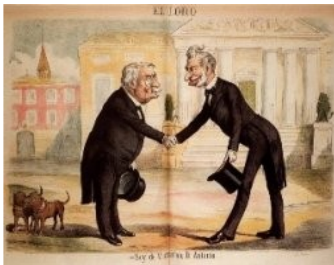
Caricatura de Cánovas e Sagasta, principais líderes da Restauración

O sistema político ideado por Cánovas ten o seu pilar fundamental na figura do monarca, arredor do cal se garante a estabilidade do sistema, grazas ás atribucións que a conservadora