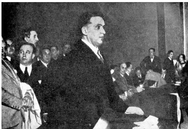
Calvo Sotelo nun acto de campaña electoral

A II República optou por un sistema electoral maioritario que reservaba o 80% dos escanos para as candidaturas concorrentes polas maiorías, outorgando o 20% restante ás minorías. Cada votante elixía dentro dunhas listas abertas a un número de candidatos igual ao de deputados electos polas maiorías na provincia en que estaba censado: isto beneficiou que os notables locais de gran prestixio puidesen presentarse polas minorías coa esperanza de ser votados polos electores que conformaban a súa propia lista, mais non se rexistraron casos de candidatos electos por estas últimas que superasen en votos aos de menos votos non electos polas maiorías.