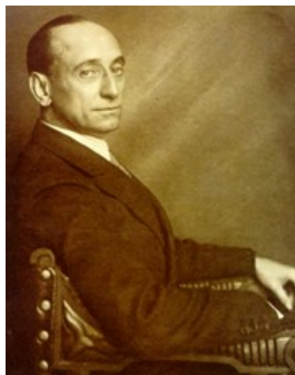
Santiago Casares Quiroga