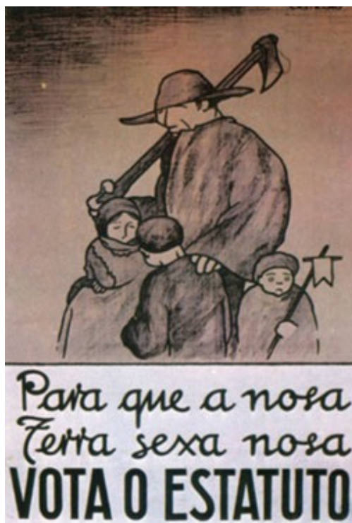
Cartaz da Campaña do Estatuto do 36

A súa debilidade organizativa e a súa escasa implantación social non lle permitiu facer forza na defensa das posturas autonomistas. Por outra banda, tampouco contou co apoio de republicanos e das forzas obreiras, ficando o nacionalismo político como unha forza residual. Esta situación de illamento foi a que forzou, tras importantes debates internos, a necesidade dunhas alianzas políticas coas forzas republicanas e de esquerdas, único camiño para que o Estatuto de Autonomía puidese saír adiante. Deste xeito xorde o pacto asinado coa Izquierda Republicana .