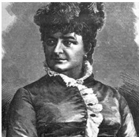
Emilia Pardo Bazán