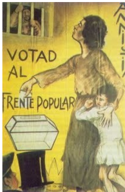
Cartaz electoral da Frente Popular

Os acontecementos revolucionarios tiveran un eco relativo en Galicia, declarándose paros xerais, en moitos casos solidarios, nas principais vilas galegas, que contaron cun seguimento desigual. Só no Ferrol e nalgúns puntos de Ourense e Lugo foi posible observar unha táctica insurreccional elaborada, coa intención mesmo de tomar o poder.