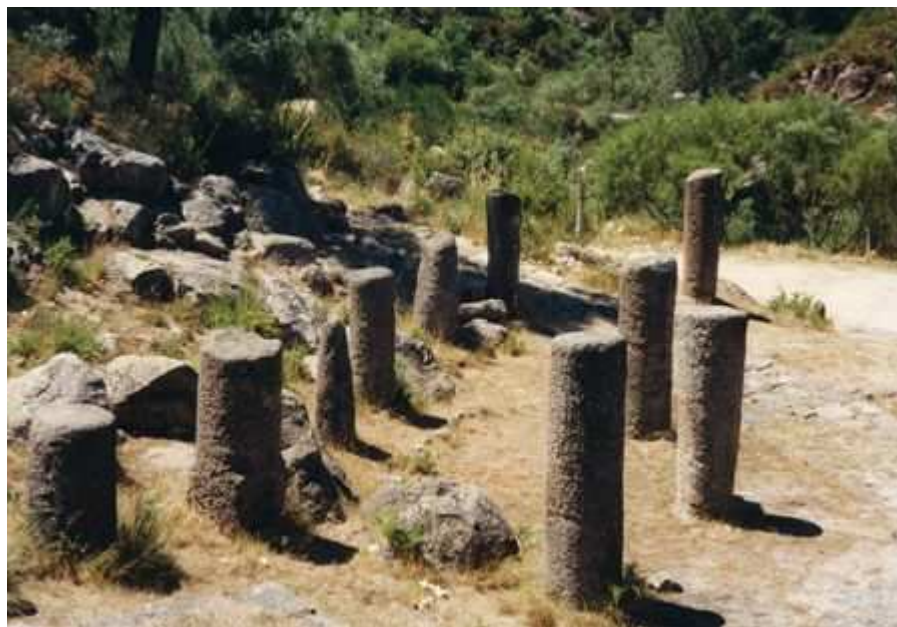
Miliario en Portela do Home (Ourense)

Os tres principais núcleos urbanos da Galicia romana e, en xeral, os tres conventos xurídicos estaban enlazados por unha rede de comunicacións baseada en vías trazadas despois da conquista. Estes camiños pavimentados supoñen un factor decisivo na organización do territorio e responden nun principio a fins militares pero, fundamentalmente, a intereses comerciais. A rede viaria galega en época romana estruturábase en torno a catro grandes rutas de comunicación ás que hai que unir varias vías secundarias, destacando por riba de todas elas a que une Bracara con Asturica , as capitais dos dous conventos máis poboados e máis activos economicamente (minería). As vías, sobre todo as principais, inclúen ademais edificacións dedicadas a pousadas para durmir ou descansar, mansións ou miliarios (columnas que se colocan ao borde das calzadas mil passus , é dicir unha milla romana equivalente a 1.481 metros).