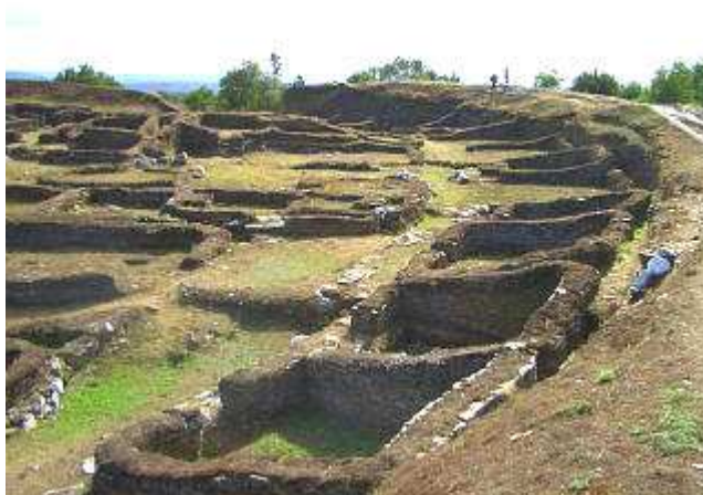
Detalle do Castro de Viladonga (Lugo)

asentamentos de zona sur son maiores e ofrecen unha riqueza construtiva superior aos do norte. Os muros son máis anchos e posiblemente máis altos e as casas presentan formas máis complexas ao engadirlles en ocasións elementos como lareiras interiores ou muros en forma de angos de cangrexo a modo de vestíbulo que pode acoller o forno ou bebedeiros para os animais. Tamén nos grandes castros aparecen agrupamentos de construcións rodeadas por un muro e cunha única entrada que con probabilidade acollerían unidades familiares (son as denominadas casas-patio). Ademais das vivendas temos constancia de recintos para diversos usos como cortes para animais, obradoiros de fundición, baños, etc. Exemplos de poboados de grandes dimensións son o de Santa Tegra en Pontevedra, o de San Cibrao de Las en Ourense ou os de Borneiro, Elviña ou Baroña na provincia de A Coruña.