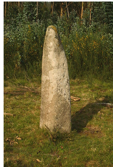
A Lapa de Gargantáns (192x50 cm)

pertencen. Algúns exemplos son mámoas como Casa dos Mouros e Arca da Barbanza na provincia de A Coruña, A Casola do Foxo en Muíños (Ourense) ou a Mámoa da Abelleira en Xermade (Lugo).