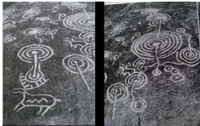
Petróglifos en Campolameiro

Outra manifestación característica da Idade do Bronce en Galicia son os petróglifos ou gravados rupestres. Trátase de incisións sobre rochas graníticas que aparecen, polo tanto, ao aire libre. As formas decorativas que representan son moi variadas e van dende representacións naturalistas con motivos zoomorfos (sobre todo cervos e cabalos) e antropomorfos ata representacións simbólicas nas que predominan debuxos xeométricos como espirais, círculos concéntricos e liñas onduladas e serpentiformes. Resulta complicado precisar tanto a súa cronoloxía como o seu significado. No que respecta ao seu marco cronolóxico, parece que a etapa de maior desenvolvemento é a Idade do Bronce aínda que se manteñen na cultura castrexa posterior. En canto ao significado, parecen representar un mundo simbólico e ideolóxico que non somos capaces de descifrar, vinculado en ocasións co ámbito relixioso ou funerario. En Galicia, os petróglifos localízanse basicamente na zona das Rías Baixas, sobre todo, no val medio do Lérez (nos concellos pontevedreses de Campo Lameiro e Cotovade).