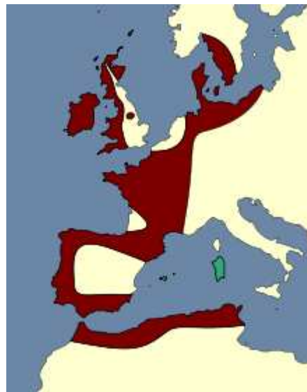
Extensión do Megalitismo en Europa e Norte de África.

En Galicia, tradicionalmente, Neolítico e Megalitismo téñense considerado practicamente como sinónimos. Porén, hoxe sabemos, gracias ás probas xa citadas (polen, prospeccións...), que existen en Galicia actividades típicas do Neolítico (agricultura, gandería, etc.) en etapas previas á chegada dos primeiros construtores de túmulos megalíticos procedentes de Portugal (mediados-finais do IV milenio a.C.). Este fenómeno cultural, característico sobre todo da fachada atlántica europea dende Suecia ata o sur de Europa, desenvólvese en Galicia ao longo do terceiro milenio antes de Cristo. A súa importancia é tal que podemos falar de dous períodos no Neolítico: o Neolítico premegalítico, e o período megalítico propiamente dito.