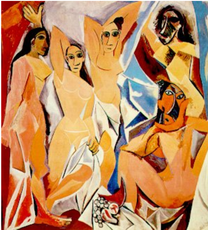
Picasso. As señoritas de Avignon