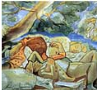
Maside, A sesta