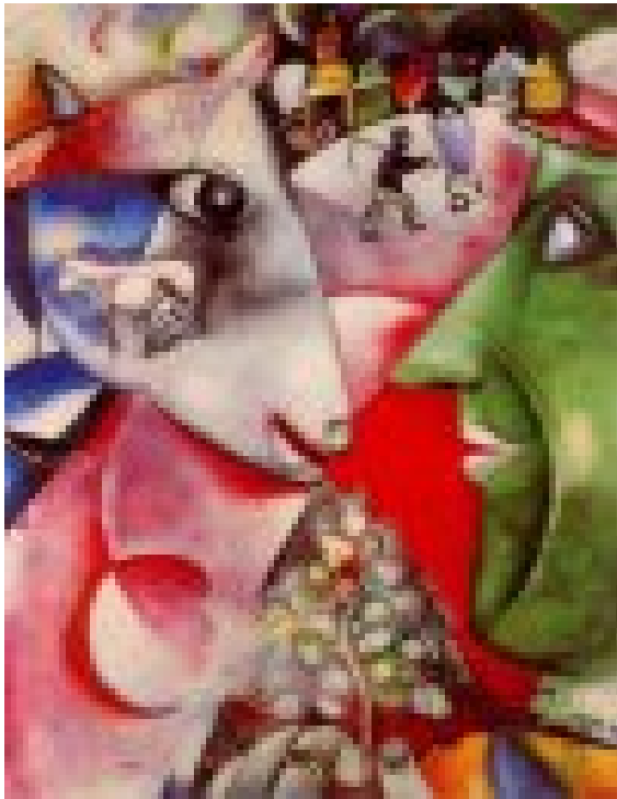
Marc Chagall , Eu e a aldea