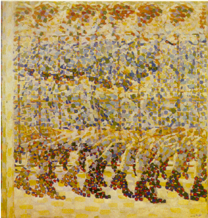
G. BALLA, Nena correndo polo balcón