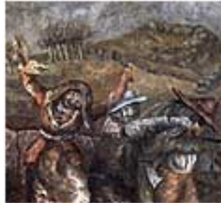
Laxeiro, O antroido