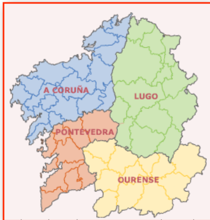
Mapa das comarcas procedente do SITGA

En 1997 aprobouse o Mapa Comarcal de Galicia que constitúe a referencia básica para a reorganización territorial dos servizos públicos da Xunta, define o ámbito de aplicación do PDC de Galicia. Tras un longo proceso de elaboración o país estrutúrase en 53 comarcas.