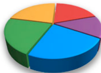
Cómo se emplean los fondos regionales

A España corresponderanlle 35217millóns de € repartidos tal e como se comenta: