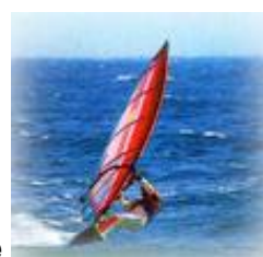
La planche à voile