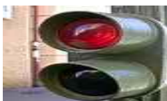
Continuer jusqu'au feu rouge