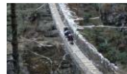
Traverser le pont