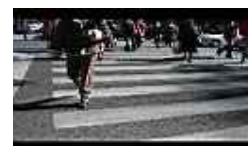
Traverser la rue par le passage piétons.