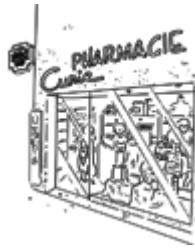
La pharmacie (farmacia)