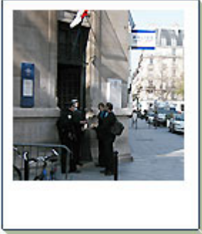
Le comisariat de police (comisaría)