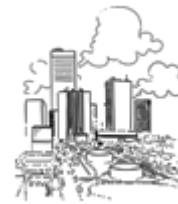
La ville (cidade)