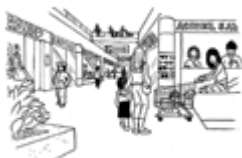
La grande-surface (centro comercial)