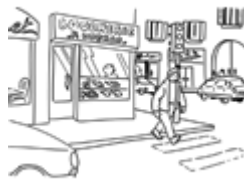
La rue (rúa)