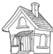
La maison (casa)