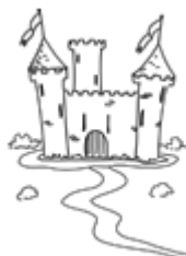
Le château (castelo)