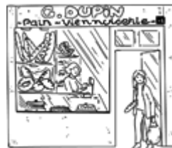
La boulangerie (panaderia)