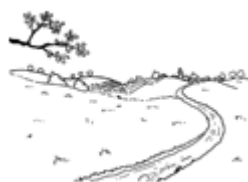
La campagne ( campo)