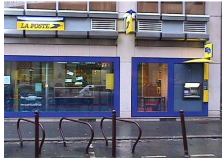
La poste (correos)