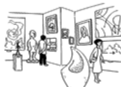
Le musée (museo)