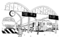
La gare (estación)