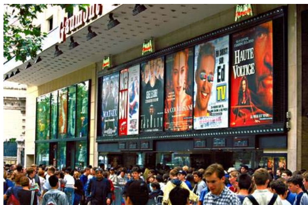
Le cinéma (o cine)