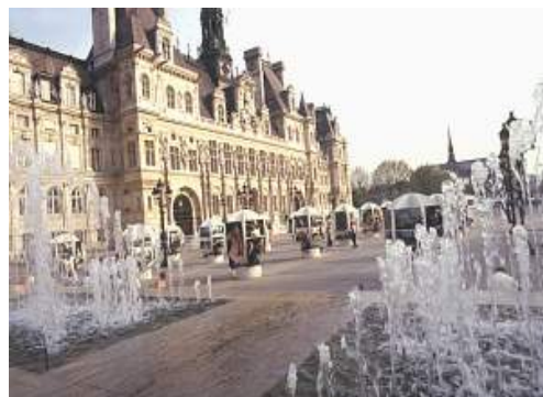
L'hôtel de ville (concello)