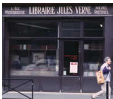
La librerie (librería)