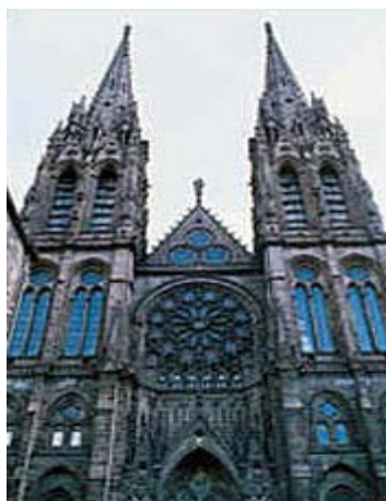
La cathédrale (catedral)