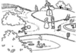
Le parc (parque)