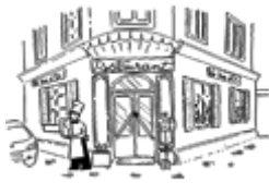
Le restaurant (restaurante)