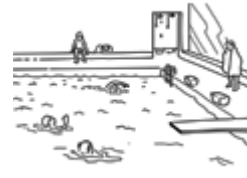
La piscine (piscina)