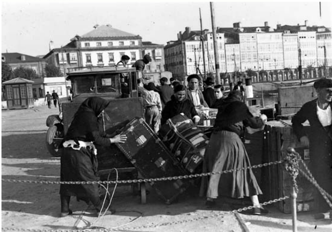
Maleteiras cargando no porto da Coruña. 1910

Decenas de milleiros de españois arribaron a estes países entre 1882 e 1967, con dúas grandes etapas de chegadas: