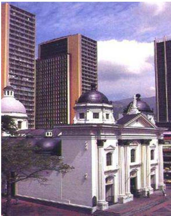
Veracruz. Venezuela. Tradición e modernidade

A finais do século XX só dous dos grandes países, México e Brasil, podían ser consideradas economías emerxentes con industrias competitivas e de gran peso no comercio. Para recuperarse da crise, e seguindo os consellos dos economistas de Estados Unidos, a maioría dos países impuxeron políticas económicas neoliberais, impulsando a liberdade de comercio, a escasa intervención do Estado, e a apertura aos capitais estranxeiros.