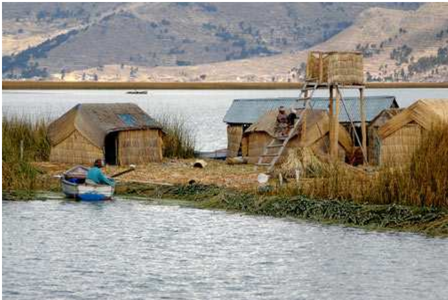
Vivendas dos Indíxenas uros. Lago Titicaca. Perú

O aumento demográfico seguiu sendo enorme. O máis característico deste aumento nas últimas décadas foi o abandono do campo e a concentración nas cidades, de forma que en Iberoamérica se atopan moitas megalópolis: México é a maior cidade, con 25 millóns de habitantes, seguida de Sao Paulo e Bos Aires.