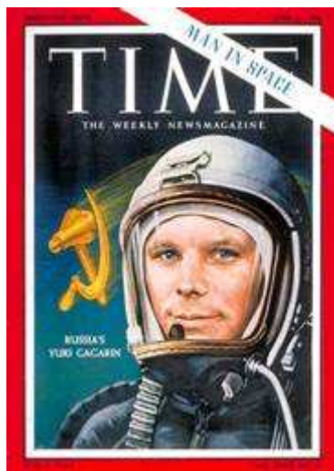
O astronauta Yuri Gagarin

A Unión Soviética saíu enormemente engrandecida da Guerra Mundial e os seus dirixentes iniciaron un proceso para facer da súa zona de ocupación europea unha única rexión integrada. Os rusos basearon a súa dominación na permanencia do exército en toda a área, pero non había unha coordinación de bloque e os resultados variaban moito dun país a outro. A oferta do Plano Marshall colleunos desprevenidos, como demostrou a aceptación inicial de Polonia e Checoslovaquia 5 . Pero o rexeitamento da axuda norteamericana deixaba ao bloque socialista nunha situación difícil. Imposibilitados para restaurar as relacións económicas con Europa occidental, os dirixentes soviéticos víronse no compromiso de acelerar o proceso de integración dos seus aliados para organizar un sistema o máis autárquico posible. Fronte ás iniciativas norteamericanas, especialmente á Doutrina Truman , a URSS reaccionou aceptando a teoría do mundo bipolar, e optou por liderar o bloque comunista encarrando a nova época cunha estratexia de confrontación baseada fundamentalmente en seis puntos: