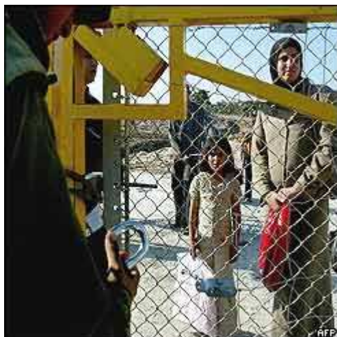
Control da poboación palestina

recoñecemento da soberanía, da integridade territorial e da independencia de cada estado da rexión. Afirmaba, ademais, a necesidade de garantir a liberdade de navegación nas augas internacionais da rexión así como de conseguir unha solución xusta ao problema dos refuxiados. Ningunha das partes aceptou a resolución na súa totalidade e os incidentes fronteirizos continuaron, sendo os Estados Unidos os subministradores de armas a Israel e a URSS a abastecedora dos países árabes.