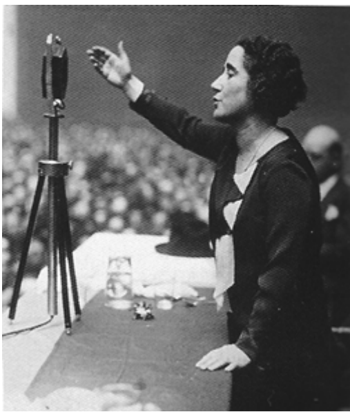
Clara Campoamor nas Cortes de 1931

Clara Campoamor pola contra argumentou nas Cortes Constituíntes que os dereitos do individuo esixían un tratamento igualitario para homes e mulleres e que a Constitución republicana debía eliminar calquera discriminación por razón de sexo.