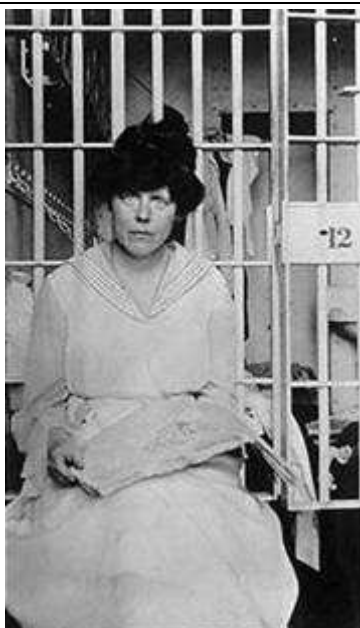
B. Lucy Burns na prisión

A Guerra exerce menos influencia nas sufraxistas aínda que utilicen o argumento da necesidade do sufraxio para o esforzo da guerra e da democracia. Así a NWP aplica a estratexia de castigar ao partido no poder. Durante meses se instalan fronte á Casa Branca grupos de manifestantes encadeadas ou tiradas no chan da estrada. Isto era en 1916 e houbo que esperar tres anos mais para conseguir o dereito ao voto. As feministas foron "abandonadas" polos abolicionistas despois da guerra de Secesión, e deberán loitar durante tres cartos dun século para lograr os seus obxectivos.