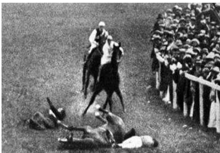
B. Davison tirouse aos pes do cabalo como protesta. 1913

Para as mulleres e rapazas das clases medias e acomodadas, acostumadas a exercer a caridade, a guerra é un período de intenso traballo, que pon en perigo cousas como a moda ou a sociabilidade burguesa. As maiores se afilian á Cruz Vermella e en moitos casos se lles confía a dirección de hospitais auxiliares ou a condución de ambulancias, e incluso se as manda ao fronte. Mentres Marie Curie impón, coa colaboración da súa filla, a radiografía de guerra e pon en circulación unha flota de vehículos radiolóxicos. A enfermeira é o personaxe feminino máis encomiado da guerra.