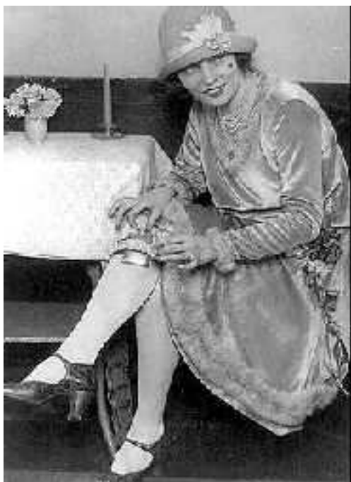
Muller con petaca

Que transformacións se produciron para as mulleres nesta sociedade de consumo? Solo supón alistarse no traballo nas fábricas ou no taller. A nova ama de casa, capaz de racionalizar o traballo doméstico tanto no aspecto temporal como de rendimento, preséntase como o complemento do home na produción externa do fogar. O funcionamento da casa debe asimilarse e integrarse á organización da sociedade. Trátase de taylorizar o traballo doméstico, coa oferta de electrodomésticos e novo equipamento. A ama de casa debe ser ao mesmo tempo consumidora e administradora do fogar. Debe facerse responsable do control do consumo, o que require unha coidadosa administración e planificación, incluso a compra a crédito e os proxectos a longo prazo. Así pódese entender a forte implantación que teñen nos Estados Unidos os grandes almacéns entre 1890 e 1940. Deseñan un novo tipo de