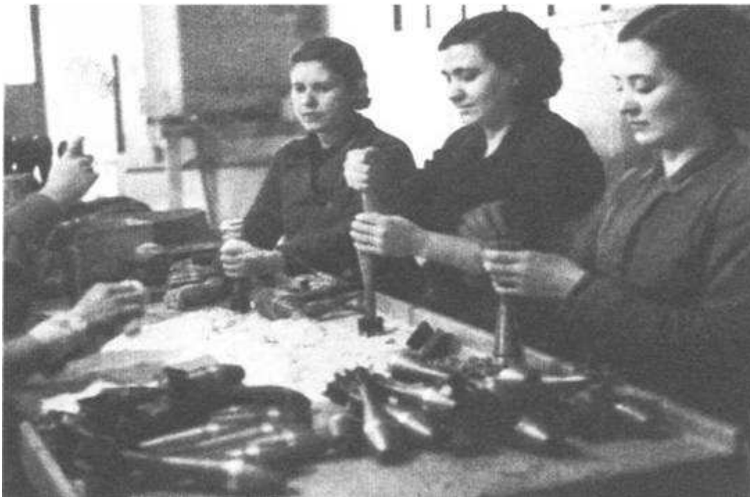
Fábrica de bombas

Os estados que entraron en guerra apostaban por unha guerra curta e tiñan a esperanza posta na resignación das mulleres, porque rexeitan as propostas femininas de servizo, que propoñían as feministas, deixando as súas reivindicacións a un lado.