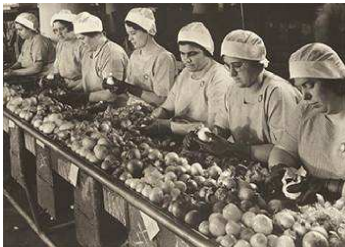
Burke-White. 1935. Cambellbg

Despois da guerra chegou o momento de afastarse e deixar o seu lugar aos homes. Pídeselles, no nome dos dereitos dos ex-combatentes, no nome da reconstrución