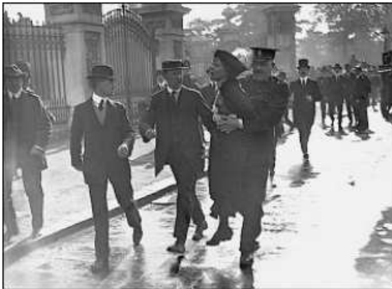
Detención de Emmeline Pankhurst

Coñecida figura do movemento pola emancipación feminina foi a británica Emmeline Pankhurst (1858-1928), fundadora da Unión Social e Política de Mulleres (WSPU) e inspiradora de diversos tipos de protesta (manifestacións, folgas de fame, etc).