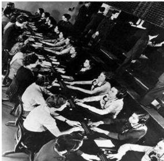
Burke-White. Wall Street. 1936

Isto desemboca nunha campaña que obstaculiza o traballo feminino ao presentar a proposta de prohibilo legalmente para as mulleres casadas (Bélxica, Italia,...) mentres que por outra parte se enxalza o traballo doméstico esaxerando o papel educativo das nais e a importancia que para a boa marcha da familia ten o feito de que se ocupen exclusivamente as mulleres do coidado da casa.