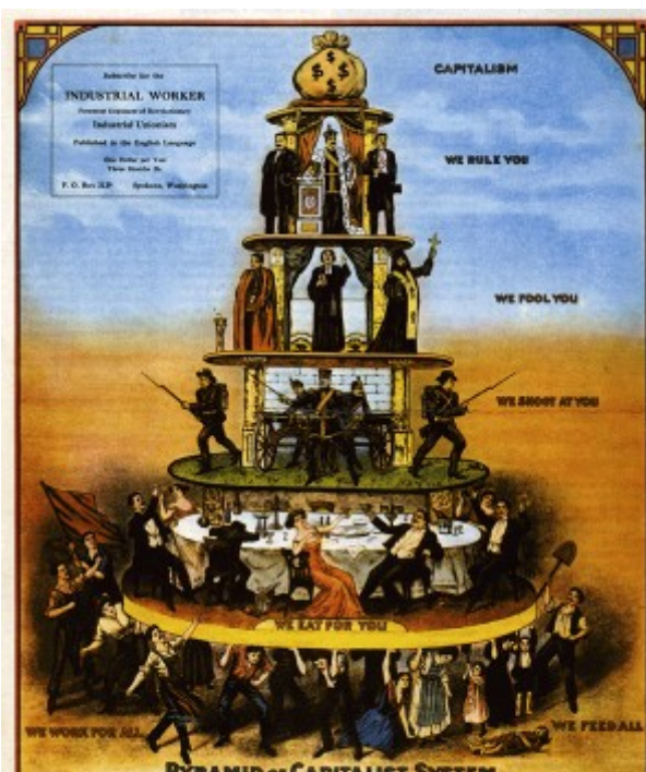
Debuxo anticapitalista publicado nun xornal de EE UU (1911)

Un dos aspectos característicos da sociedade liberal, de clases, é a mobilidade social; é dicir, a posibilidade teórica de promoción social, de pasar dunha a outra clase social. A sociedade capitalista xustifica as diferencias sociais no éxito ou fracaso de cada persoa, polo que en teoría calquera pode progresar gracias ao seu esforzo e coñecementos ata adquirir o éxito económico que leva consigo o recoñecemento social, integrándose na clase alta.