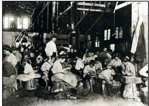
Fábrica de conservas en EE UU, Ahine (1910)

Os rapaces eran maltratados e estaban mal alimentados, desatendidos se a nai