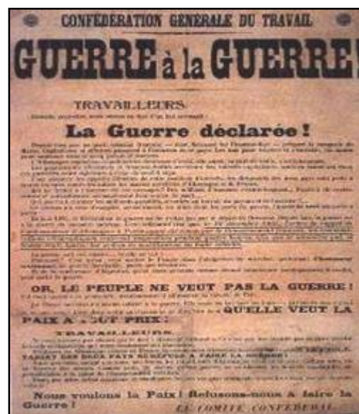
Cartel dos sindicatos franceses contra a guerra (1905)

Os seguidores da revolución soviética adoptaron o nome de comunistas e se coordinaron nunha nova Internacional, a III