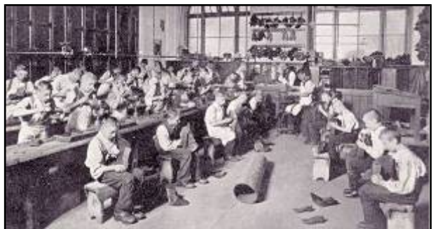
Taller de zapatos nunha workhouses (1910)

Para tratar de paliar a dramática situación dos obreiros creáronse casas de beneficencia e de caridade que, ás veces, non supuñan ningunha mellora. As casas de traballo británicas (workhouses), creadas en 1834 pola Lei de Pobres —<<instrumentos de tortura civil>>— obrigaban ao internamento dos indixentes e introduciron o traballo obrigatorio nun réxime carcerario.