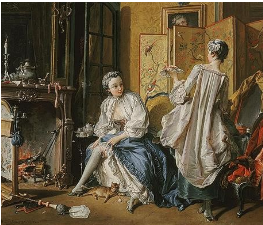
F. Boucher La Toilette .

Os desmaios románticos que sufrían á menor alteración emocional debíanse, ante todo, ao uso opresivo do corpiño; as estrañas enfermidades consideradas exclusivamente femininas, como a clorosis e a histeria, frecuentes no século XIX, debíanse, segundo a perspectiva actual, á rixida represión sexual e dos sentimentos. Os vestidos das mulleres de clase alta obrigaban a adoptar posturas pouco naturais, como sucedían cos miriñaques ou os polisones, que forzaban a figura da muller.