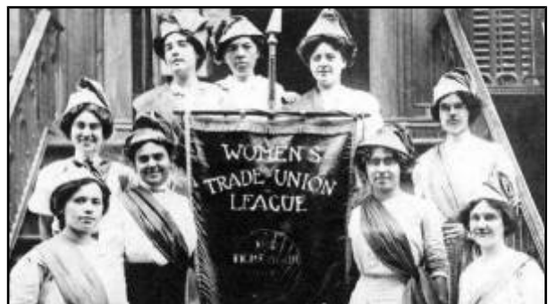
Trade Union League de Nova Iork (1900)

A lexislación protectora do traballo da muller puxo fin a súa sobreexplotación, pero detivo a incorporación da muller ao mundo laboral. A comezos do s. XX profundouse a división do traballo no seo das familias traballadoras: mentres o home tiña encomendada a aportación dun salario, á muller reservábaselle o traballo doméstico e o coidado da familia. Outras mulleres, de clase media, accederon a postos educativos e administrativos e delas e das mulleres con estudos naceu o movemento pola igualdade de dereitos, comezado polo dereito ao voto (sufraxismo), impulsado en boa medida polos socialistas.