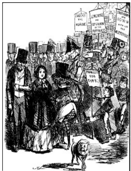
A terceira petição cartista, Punch Magazine (1848)

O voto era o medio pensado para conseguir as melloras socioeconómicas: ‘O cartismo, amigos meus, non é un problema político, segundo o cal se trataría de que acadedes o dereito ao voto; senón que o cartismo é unha cuestión de garfo e coitelo, é dicir, que a Carta significa boa vivenda, boa comida e bebida, un bo pasar e unha xornada de traballo breve’ .