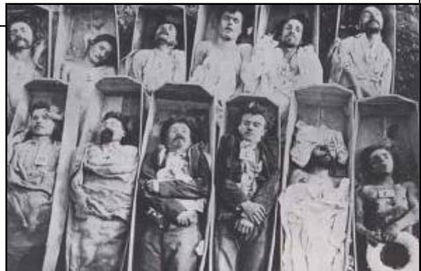
Fusilados por participar na Comuna (1871)

A AIT non tiña moita forza, pero as autoridades achacábanlle a participación en case tódolos conflitos habidos en Europa entre 1868 e 1873. En 1871 acusárona de estar detrás da sublevación republicana de París, despois da derrota francesa ante os prusianos. A Comuna de París converteuse no primeiro goberno obreiro da historia, pero a penas durou dous meses. A represión foi durísima: 17.000 mortos e 47.000 detidos.