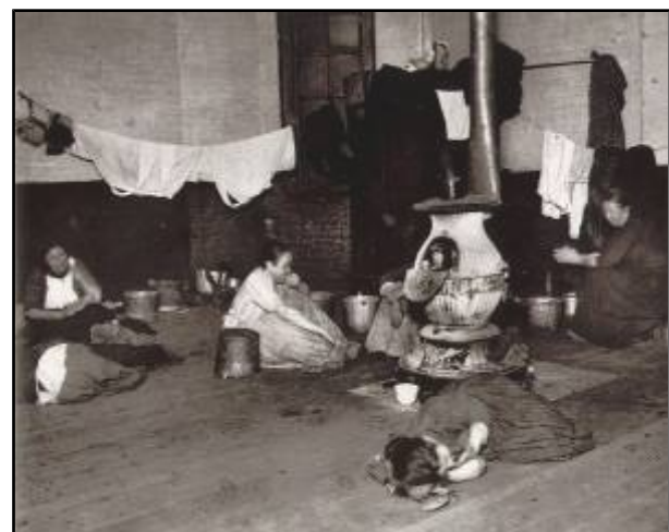
Habitación de mulleres en Nova Iork, Riis (finais do XIX))