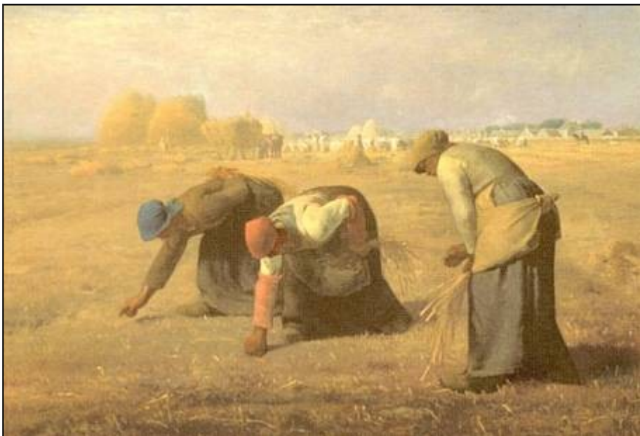
B. Millet As espigadoras

Para as mulleres campesiñas e obreiras a situación era moi diferente. Desde sempre as mulleres do campo desenvolvían as tarefas domésticas e agrarias. Neste campo se lles asignaban labores específicos: escarda, vendima, recollida da oliva, aínda que tamén adoitaban axudar no coidado do gando, a sega e outras tarefas máis