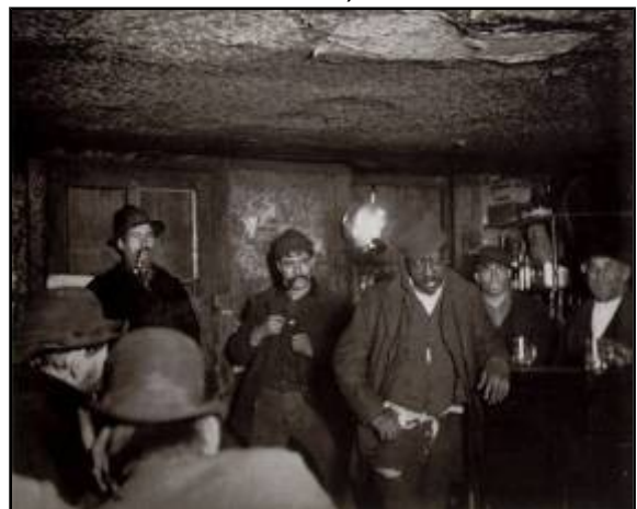
Taberna en Nova Iork, Riis (finais do XIX)

As condicións de vida do proletariado foron extremadamente duras nos inicios do proceso de industrialización, sobre todo entre os traballadores das minas e dos primeiros núcleos fabrís. As condicións de traballo eran impostas unilateralmente polo empresario. Os obreiros, que non contaban con ningún tipo de propiedade non lles quedaba máis remedio que ofrecer a súa capacidade de traballo (o seu esforzo) e a cambio non recibían máis que un salario que tan só lles permitía subsistir (reproducir a forza de traballo).