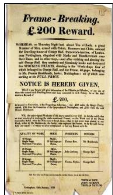
Recompensa por ludditas (1812)

A introdución das máquinas aumentou a produción empregando un menor número de traballadores. A mecanización supuxo para moitos a perda do emprego e para outros un descenso dos ingresos. Cando o empresario non daba vendido todo o que producía e paraba ou reducía a produción ata que volvía aumentar a demanda. Cando os traballadores perdían o seu traballo non tiñan seguros de paro nin outros ingresos e non é raro que lle botasen a culpa ás novas máquinas das súas desgracias, polo que en moitos lugares houbo revoltas nas que se destruíron máquinas. Este tipo de protesta coñécese co nome de «movemento luddita», e en moitos