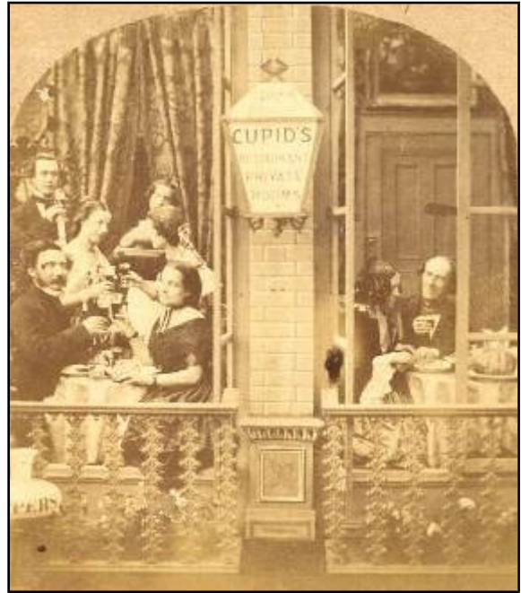
Restaurante Cupido en Londres (1860)

* A pequena burguesía : estaba formada por funcionarios; pequenos comerciantes que levaban persoalmente o seu negocio familiar sen contratar man de obra asalariada ou nun número moi reducido; artesáns; campesiños acomodados, que eran propietarios das súas terras e que as traballaban persoalmente... etc. Neste grupo de pequena burguesía, poderían ser incluídos os empregados con certa cualificación profesional.