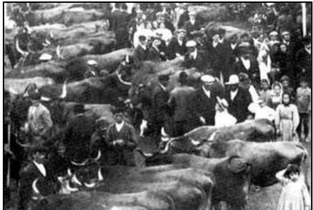
Concurso de gando en Ortigueira (1910)

En Galicia, fronte ao que ocorreu noutros países europeos, o campesiñado seguiu sendo o grupo social máis importante, un 90% da poboación. O campesiñado seguiu pagando os foros, como no Antigo Réxime, e non foi ata principios do século XX cando conseguiu o diñeiro necesario para a redención dos foros e a consecución da plena propiedade da terra a través das remesas procedentes da emigración a América e dos beneficios da gandería e a explotación da madeira.