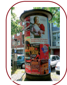
Carteles con poste de publicación, Colonia, Alemania.