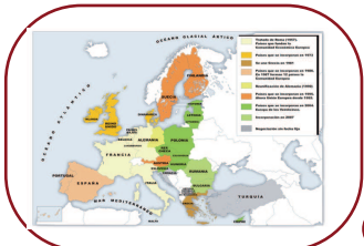
Mapa de la Comunidad Europea Ilustrador: José Alberto Bermúdez