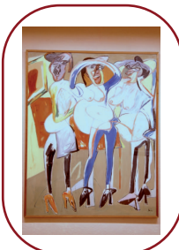
Obra pictórica de Juan Barjola, Badajoz.