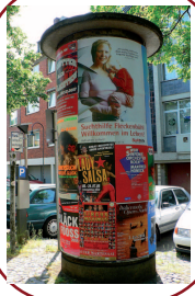
Carteles con poste de publicación, Colonia, Alemania.

Estética: Son obras de arte que expresan sentimentos e beleza.