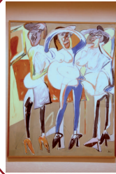
Obra pictórica de Juan Barjola, Badajoz.