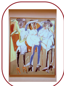
Obra pictórica de Juan Barjola, Badajoz.