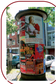
Carteles con poste de publicación, Colonia, Alemania.