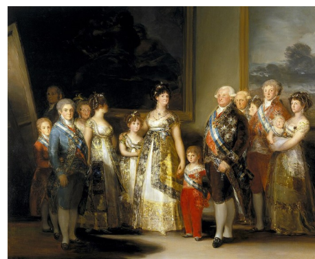
A familia de Carlos IV