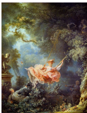
Fragonard: A randeeira (1767)