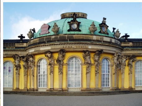
G. W. von Knobelsdorff: Palacio de Sanssouci, Potsdam, Alemaña (1745-1747)