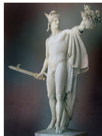
Antonio Canova: Perseo coa cabeza de Medusa (1800-1801)