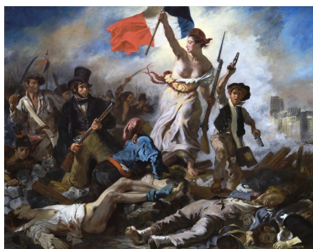
E. Delacroix: A liberdade guiando o pobo (1830)