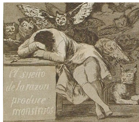
O sono da razón produce monstros