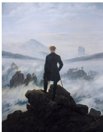
C. D. Friedrich: O camiñante sobre o mar de nubes (1817-1818)