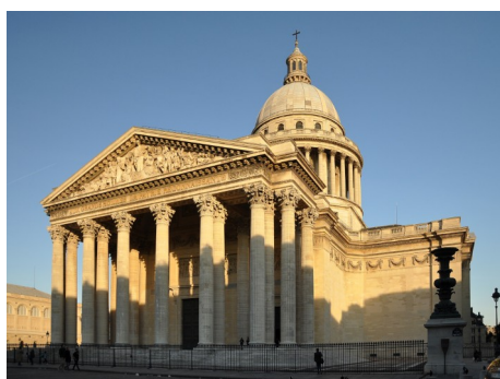
J. G. Soufflot: Panteón de París

A escultura é serena e proporcionada, con predominio do mármore. O escultor neoclásico máis salientable é o italiano Antonio Canova.