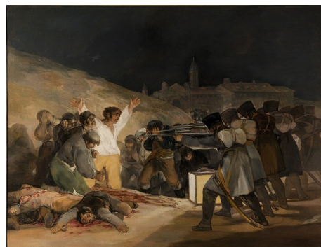
Os fusilamentos do tres de maio