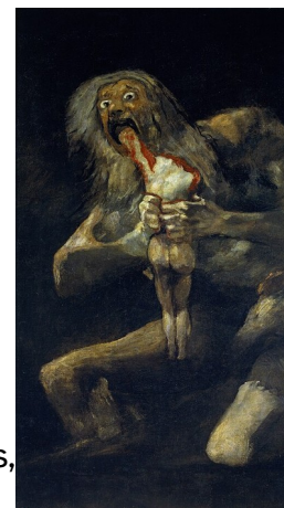
Saturno devorando o seu fillo