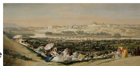
A pradeira de San Isidro