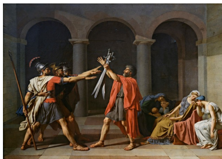
O xuramento dos Horacios