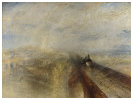
W. Turner: Chuvia, vapor e velocidade (1844)