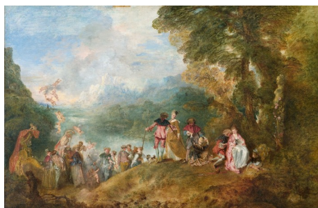
Jean-Antoine Watteau: O embarque para a illa de Citera (1717)

En arquitectura son salientables palacios como o de Sanssouci (Alemaña) ou Queluz (Portugal). En pintura destacan artistas franceses como Watteau, Boucher e Fragonard. Este último é autor dun dos cadros máis célebres do rococó: A randeeira .