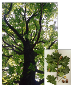
Quercus robur. Carballo

Exemplo da creación dun póster correspondente ao clima oceánico