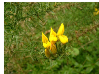
Ulex europaeus. Toxo