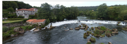
Río Tambre en Ponte Maceira. 135,2 km 54,1 m³/sg Pertence á vertente atlántica