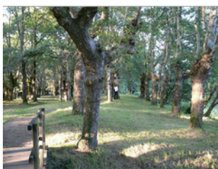
Carballeira de Chaián. Trazo