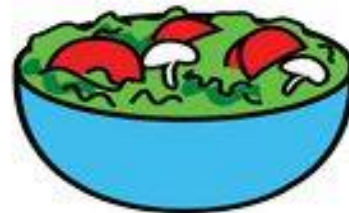
Imagen del resultado: