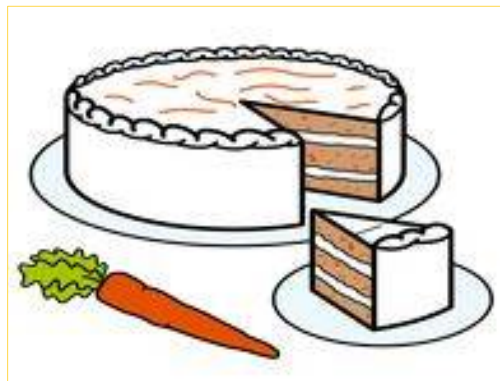
Imagen del resultado: